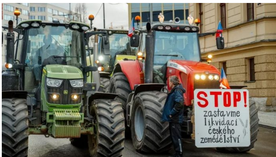
Zemědělci přijeli do Prahy protestovat, ale jen sami za sebe, podporu od protivládní opozice odmítli