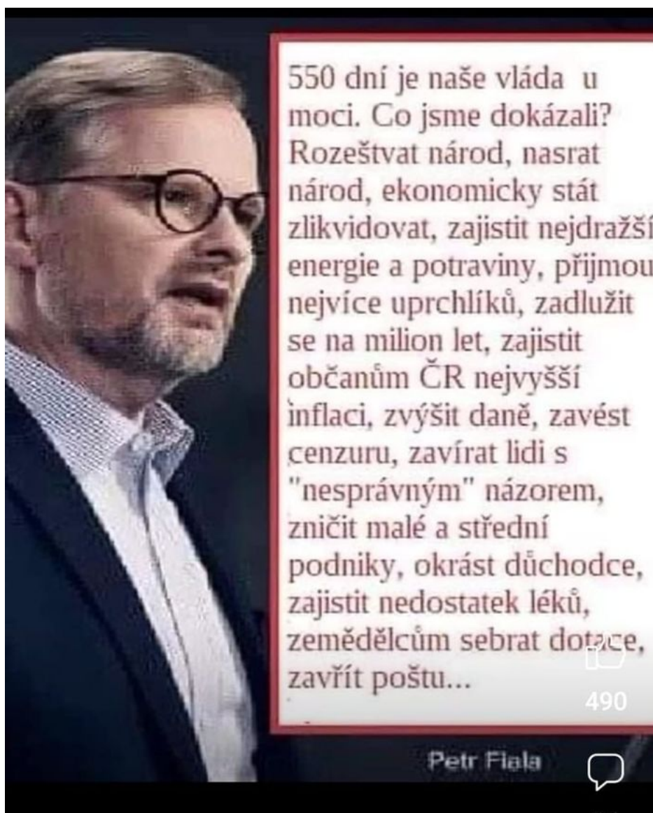
Tohle všechno, a nejen to, dokázala vláda Petra Fialy. Ale čeští zemědělci tu vládu povalit nechtějí... a tím je to dané!

Tyto offsety si totiž v ČR mohou dovolit jen velké agrokoncerny, takže malí zemědělci skončí. To je plán Green Deal na indukci manažovaného hladomoru v zemích KoZa ( Kolektivního Západu ). O to více je nepochopitelné, proč se vedení protestu distancovalo od protivládních sil, když pouze sesazení Fialovy vlády může dát malým farmářům naději na záchranu v budoucnosti. Pouze procesy urbanizace v Evropě! Kdyby šlo o autentickou demonstraci farmářů, ti by se připojili k protivládní opozici prvoplánově, protože jedině tak by bylo jasné, že svůj protest myslí vážně. Namísto toho si mysleli, že si do Prahy dojedou v traktorech pro zrušené dotace. Hmm... to je smutný konceptuální výsledek.