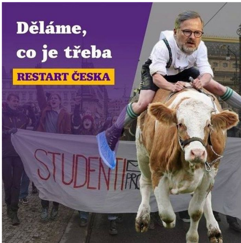
Petr Fiala si české zemědělce v podstatě osedlal. Po pondělní demonstraci si mnozí připadají, že byli na demonstraci za "volý" a právě na nich se Fiala povozil

Zemědělské protesty v ČR od dnešního dne jsou mrtvou záležitostí, protože jde zjevně o ošéfovanou nátlakovou akci s cílem vynucení si zachování dotačních rámců v dohodě s touto zkrachovalou Fialovou vládou. S touto vládou a žádnou jinou! To je ten signál, který vedení agroprotestu v pondělí jasně vyslalo. Jasný signál, který Petr Fiala jako signalista označí za hodnotový signál!