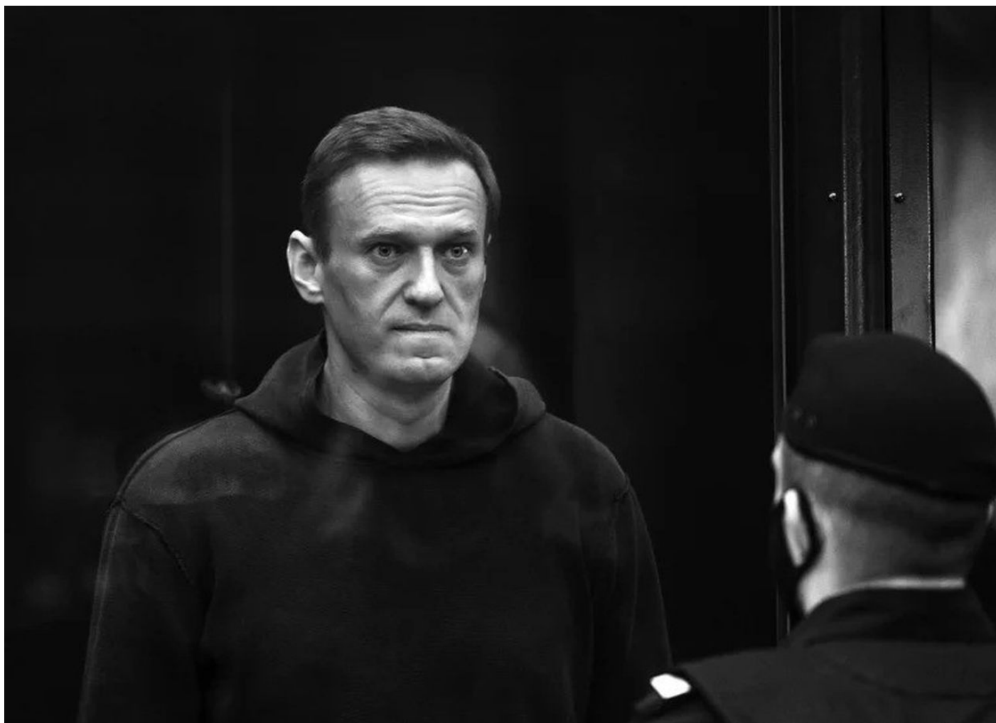
Alexej Navalny (1976 – 2024) u soudu

Jedná se o časovanou bombu, protože se ukazuje, že riziko myokarditidy roste s počtem opakovaných dávek proti nemoci Covid-19. Čím více boosterů, tím větší riziko. Spouštěčem infarktů je přitom pokaždé jeden zásadní faktor, a to je náhlé zvýšení tělesné teploty. Rizikovým tak jsou především horké sprchy, horké koupele a přechod ze zimy do vyhřáté místnosti.