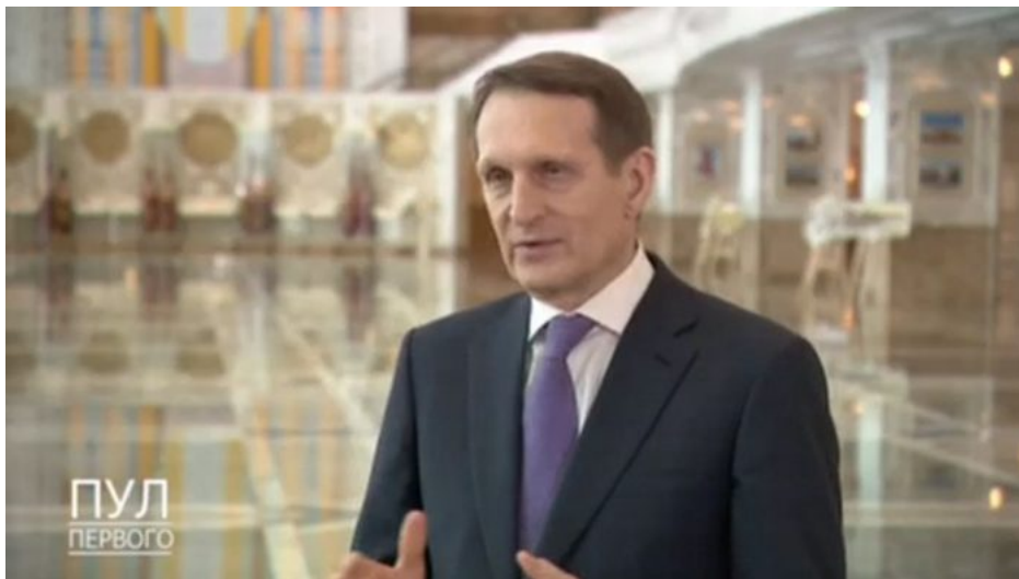
Sergej Naryškin, ředitel SVR

Tohle je naprostý šok. A mám pocit, že znám přesně moment, kdy a jak k tomuto posunu došlo. Rusko právě na počátku tohoto týdne oznámilo, že rozmístěná francouzská vojska na Ukrajině se stanou legitimním terčem pro Ruskou armádu. Vedení ruské zahraniční rozvědky (SVR) totiž uvedlo, že jakákoli francouzská vojenská jednotka vyslaná na Ukrajinu, aby jí pomohla v boji proti Rusku, bude pro ruskou armádu "prioritním" a "legitimním" cílem [2]. Sergej Naryškin varoval Francii v úterý poté, co Kreml obdržel informaci, že se Paříž chystá vyslat na Ukrajinu kontingent 2 000 vojáků v první vlně, kteří by bojovali proti Rusku.