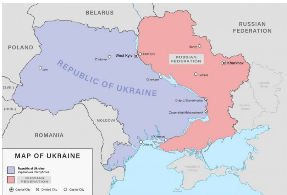
Francouzský plán na rozdělení Ukrajiny podél toku řeky Dněpr

“Dříve či později bude muset Macron odhalit ošklivou pravdu, ale bude se snažit přiznání co nejvíce oddálit.” Naryškin tvrdil, že francouzské vojenské vedení se “obává nespokojenosti” mezi aktivními důstojníky střední úrovně. “Mezi mrtvými je jich neúměrně mnoho a již v současné fázi jsou problémy s hledáním ‘dobrovolníků’ pro rotaci a nahrazení těch, kteří odpadli v ukrajinském divadle vojenských operací,” řekl.