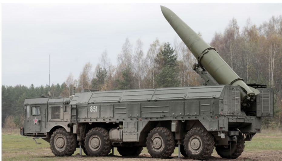
Ruský operačně-taktický komplex Iskander-M, který by vstoupil do jaderné lokální odvetvy na linii Dněpru, pokud by Francie provedla údery svými taktickými hlavicemi

Moskva musí vědět jednu věc, že kolektivní Západ hraje o své přežití a Moskva s Pekingem se netají svými plány na zničení kolektivního Západu. Je proto jasné, že tvář tvář kolapsu systému Pax Americana na Ukrajině se kolektivisté pokusí zastavit Rusko na Ukrajině všemi prostředky, a to i včetně jaderného odstrašení. A právě proto byla pro tuto roli zvolena Francie, tedy jaderná mocnost, aby vedla tento proces rozmístění vojsk západu na Ukrajině, protože Paříž disponuje jaderným odstrašením. Je jasné, že na francouzské jednotky nebude moci Ruská armáda sypat rakety, jak si to bohužel naivně a nezodpovědně vykreslují na Telegramu někteří ruští influenceři a voenkoři , tedy vojenští korespondenti.