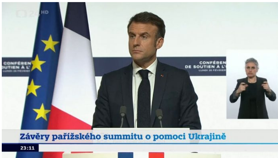
Macron už nezachraňuje Ukrajinu, ale celý kolektivní Západ!

Porcelán vyztužený jaderným odstrašením! A do tohoto bodu jsme se dostali jen pár dní poté, co kolektivní Západ pochopil, že západní sankce na Rusko totálně selhaly a Rusové se masivně a v historickém rekordu nahrnuli k volbám a rekordním počtem hlasů zvolili Putina na dalších 6 let do funkce prezidenta. Macron nezachraňuje Ukrajinu. On zachraňuje kolektivní Západ!