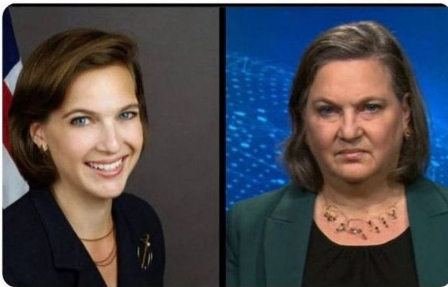
Victoria Kagan-Nuland v roce 2005 (vlevo) a v roce 2024 (vpravo). Práce mění člověka...

Jenže, byla to maskírovka. Kolářková královna z Majdanu totiž ve skutečnosti byla povýšena na šéfkou bezpečnosti a obranného zpravodajství amerického Ministerstva pro vnitřní bezpečnost (Homeland Security) a má podle Alexe Jonese na starosti vnitřní i vnější bezpečnost diplomatů a ambasád USA, přičemž velí operativcům doma i za mořem, protože její úřad má na starosti bezpečnost všech ambasád a konzulátů USA po celém světě. Dostala tedy obrovskou exekutivní moc společně s rozvědnou službou DHS spolupracující těsně se CIA v zahraničí a s FBI doma v USA a teror v Moskvě je podle všeho její premiéra ve funkci! Podle Jonese právě ona táhla v Rusku za nitky událostí a černých labutí .