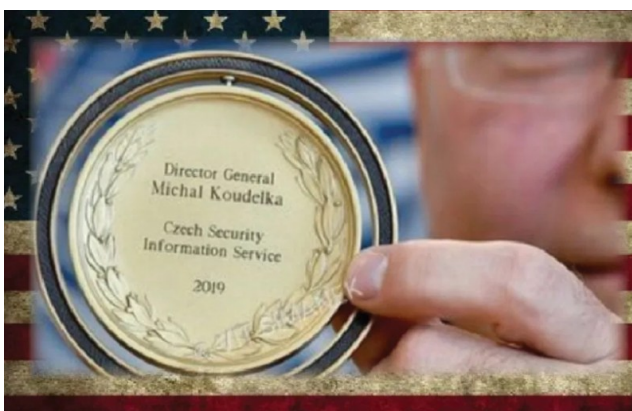
Detail Tenetovy ceny za spolupráci

Hned druhý den Agentura vnitřní bezpečnosti (polská tajná služba ABW) oznámila [3], že na základě tipu od českých kolegů provedla domovní prohlídky u opozičních politiků a při razii zabavila “obrovské” částky: Zjistili, že v těchto případech se jedná o 48,5 tisíce eur a 36 tisíc dolarů. Z čehož lze usuzovat, že Rusko si budoucí Evropský parlament koupilo doslova za almužnu. Koneckonců, když se Rusku prý podařilo zajistit Brexit za pouhých 97 centů [4], proč by Rusko průměrný poslanec Evropského parlamentu nemohl stát více, ne?