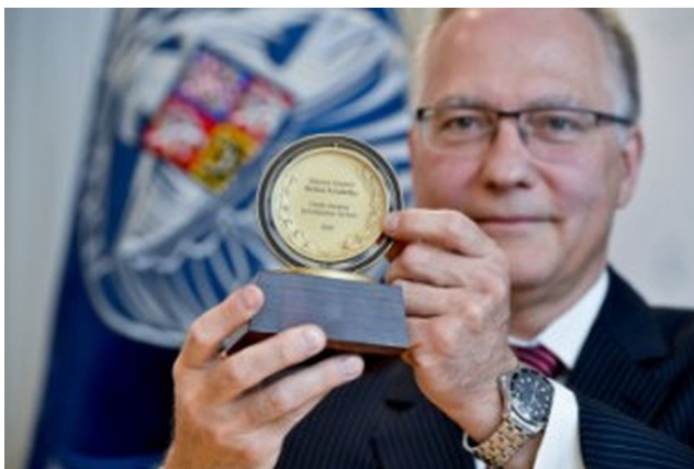
Ředitel BIS Michal Koudelka ukazuje Tenetovu cenu za spolupráci, kterou obdržel v centrále CIA v Langley v roce 2019 od tehdejší ředitelky CIA Giny Haspel

Shrňme si podstatu kauzy: minulou středu české úřady na nejvyšší úrovni (premiér, ministerstvo zahraničí a česká zpravodajská služba BIS) oznámily “senzační” zprávu [2], že Rusko prostřednictvím skromného českého webu Hlas Evropy zajišťuje “šíření protievropské propagandy” a – což je nejhorší! – prý platilo pravicové evropské politiky, aby si zajistilo vliv v Evropském parlamentu! BIS nevedla jediné jméno, omezili se pouze na výčet zemí, v nichž si tito zákeřní Rusové podle údajů BIS kupovali europoslance po celé Evropě.