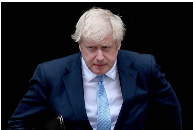
Boris Johnson jako poslanec parlamentu bral podezřele obrovské honoráře za články pro The Herald Tribune , ale nikomu to nepřipadalo podivné

Z tohoto průzkumu vyplynulo, že výsledky červnových voleb do EU parlamentu dramaticky oslabí zastoupení etablovaných euro-liberálních stran v příštím Evropském parlamentu. Televizní stanice Euronews, která si průzkum objednala, dospěla k děsivému závěru: "Znamená to, že poprvé v historii bude mít pravicová koalice zahrnující krajní pravici potenciál převzít kontrolu nad parlamentem!"