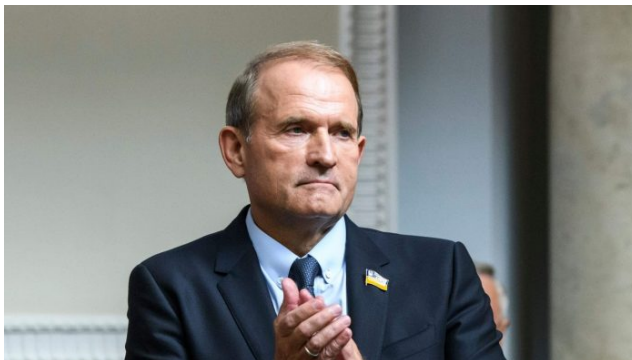
Viktor Medvedčuk, ukrajinský oligarcha známý svými proruskými postoji

Například hlavním zdrojem příjmů Borise Johnsona v době, kdy byl poslancem britského parlamentu, byly horentně placené honoráře za jeho sloupky v deníku The Daily Telegraph , což nikdo neskrýval. Legálnost těchto plateb nebyla zpochybněna, přestože byly zjevně nadměrné a podezřele nadhodnocené [5] ze strany vydavatele. Z pohledu establishmentu to však byly ty "správné" sloupky, takže z toho nikdo nedělal skandál. Ale za "špatné" názory, které se rozcházejí s názory elit, může být člověk dnes označen za "placeného agenta Kremlu", čehož jsme nyní svědky.