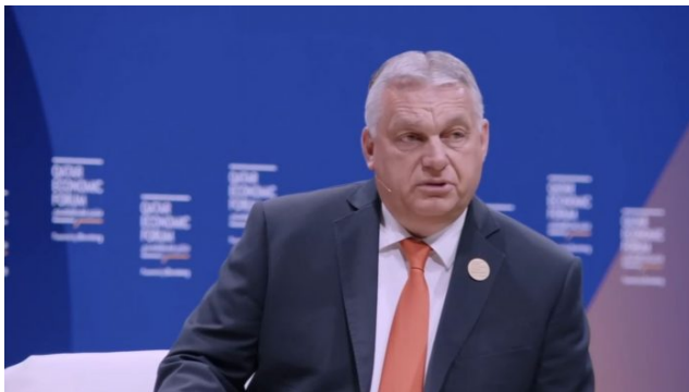
Evropské elity se bojí vlivu Viktora Orbána na nový Evropský parlament po volbách

Noviny NRC, prezentující [9] českou "senzaci", dokonce nazvaly svůj článek "Hlas Evropy – pódium pro FVD". Článek připomněl, že dva lídři této strany loni poskytli rozhovor českému webu, kde vyzvali (jaká to noční můra!) k míru na Ukrajině! Tolik tedy k obvinění. A vůbec nevdá, že představitelé strany reagovali slovy: "Chceme mír. Za předání tohoto poselství nepotřebujeme žádnou úplatu!". A tato hysterie nyní panuje prakticky ve všech zemích, které Petr Fiala vyjmenoval, kde prý Voice of Europe šířil svoji údajnou vlivovou propagandu.