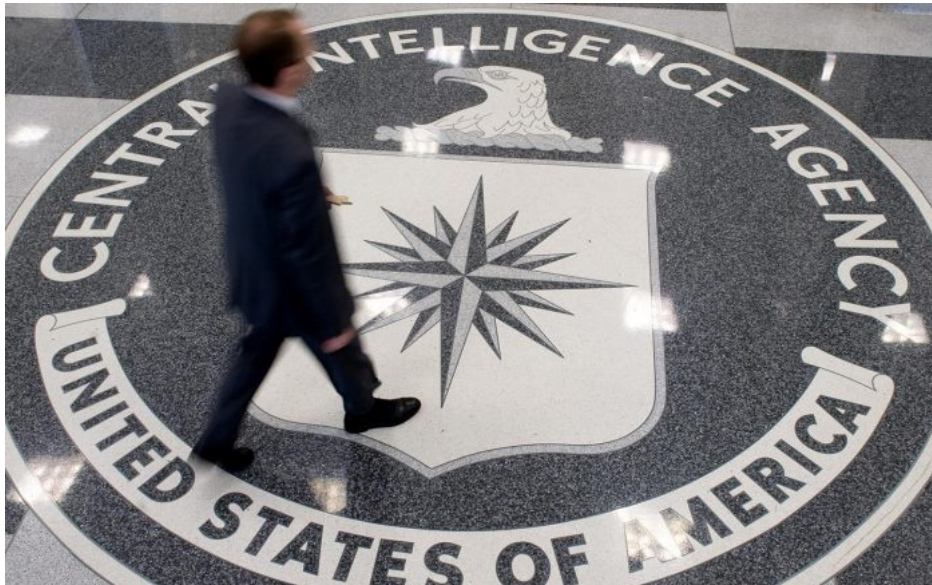
Vnitřní lobby v centrále CIA

Ovšem nástup Fialy na koberečku v Langley spolu s trojkou šéfů českých rozvědek je signálem, že situace je extrémně vážná a šéf CIA si pozval přímo premiéra Fialu, aby agenturní úkoly CIA pro české rozvědky osobně garantoval. Je naprosto neuvěřitelné, že premiér svrchované země se vůbec odváží jít do kanceláře šéfa cizí rozvědky v cizí zemi. U skutečně svrchovaných zemí je to naprosto vyloučené! Dovedete si představit, že by třeba ruský premiér vlády vzal s sebou všechny 3 šéfy FSB, SVR a GRU a při návštěvě Pekingu by s nimi přišel do kanceláře šéfa čínské rozvědky a tam by něco za zavřenými dveřmi řešili? To je naprosto nepředstavitelné. Jenže v případě českého premiéra se to právě stalo.