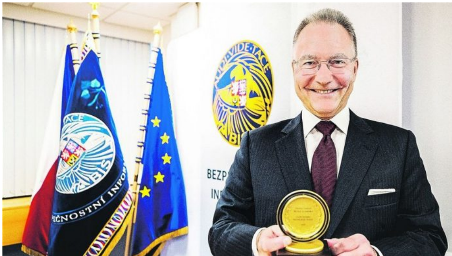
Michal Koudelka s cenou George Teneta za spolupráci se CIA v roce 2019

Takže je logické, že v Evropských volbách budou lidé volit alternativní strany. A stejně jako na Slovensku alternativa pomohla Robertu Ficovi k návratu k moci, v Česku to rovněž bude Aeronet a další alternativní média, jejichž systémový vliv na proti-vládní voliče v ČR postupně sílí. A to především proto, že přinášíme necenzurovanou a tvrdou faktografii procesů politického a destruktivního řízení současného vládního establishmentu v ČR. A budou mít vliv i příští rok během českých parlamentních voleb. Fiala určitě bude chtít aplikovat tzv. ruskou stopu i na svoji porážku ve volbách do sněmovny v roce 2025.