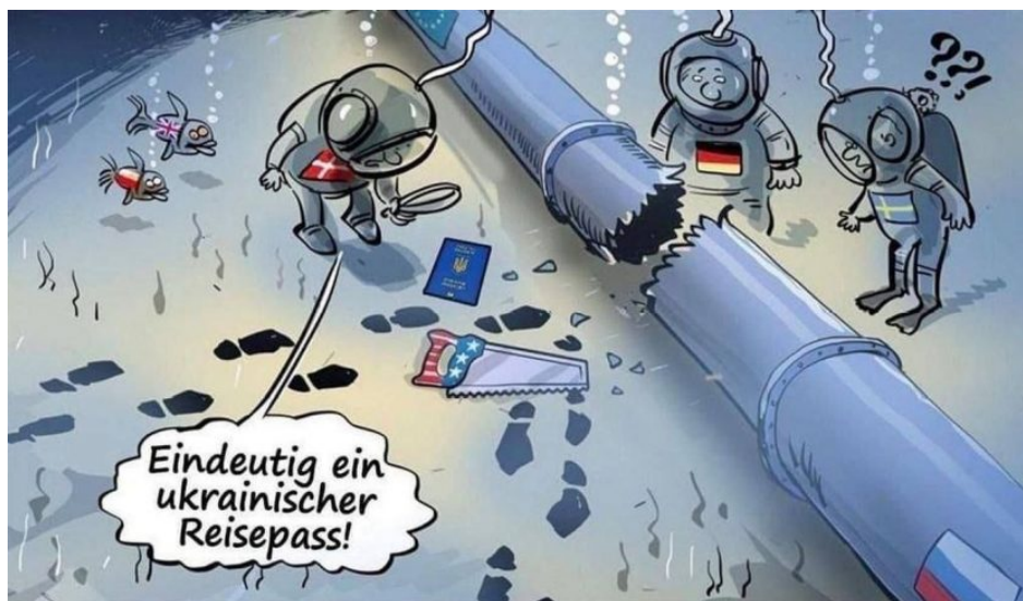
"Jednoznačně ukrajinský pas."

Potom ty peníze putují i na Slovensko na financování demonstrací proti Robertu Ficovi, putují do Maďarska na financování protestů proti Viktoru Orbánovi. Putovaly i do ČR na financování protestů proti Miloši Zemanovi. A to všechno jen díky existenci petrodolaru! A když někdo ohrozí existenci petrodolaru tím, že připraví plán na odchod celé EU od fosilních paliv a tím pádem na odchod od petrodolaru, jako vymyslela Merkelová, dopadne to úplně stejně jako na zdánlivě sarkastickém obrázku níže, který popisuje "vyšetřování" výbuchů plynovodů Nord Stream 1 a 2.