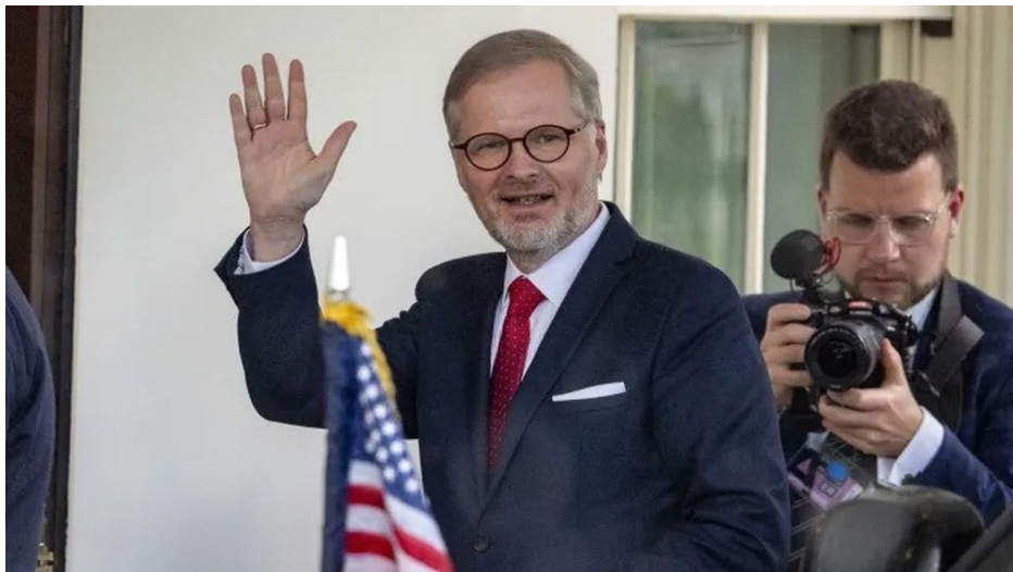
Petr Fiala mává novinářům před Bílým domem.

První vlaštovku již Fialova rozvědná skupina odpálila před 2 týdny podivnou kauzou Voice of Europe , což podle všeho je zpravodajská hra z Langley [3], protože ten web nikdo do posledního okamžiku vůbec neznal, ale najednou česká BIS před ním varovala všechny rozvědky a všechna média. Je to přípravná fáze hochů z Čučkárny, příprava pro obvinění Ruska z výsledku Evropských voleb v červnu. Je to naprosto průhledné.