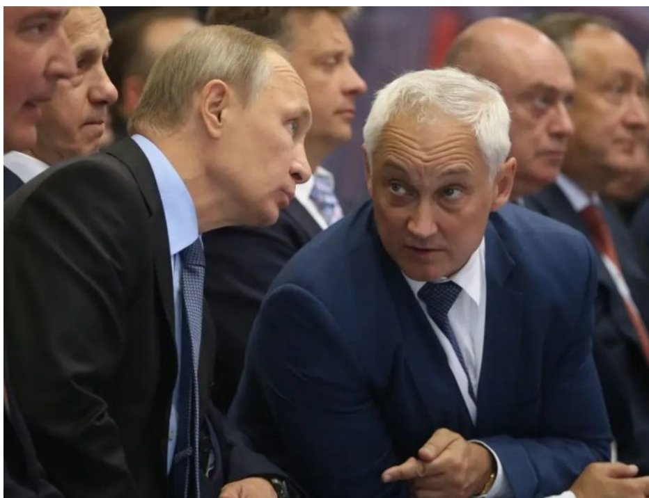
Vladimir Putin a Andrej Belousov

Kreml si tak spočítal, že jedinou cestou, jak Ukrajině, resp. vedení NATO v Bruselu, zabránit v přijetí do aliance, je transformace Speciální vojenské operace (SVO) na Ukrajině do Trvalé speciální vojenské operace (TSVO) na Ukrajině. Protože pouze trvalý válečný stav na Ukrajině zajistí, že NATO nepřijme Ukrajinu za svého člena. Existuje v podstatě jenom jeden nástroj, jak nepřijmout Ukrajinu do NATO, a to je Ukrajina, na jejíž území dopadají ruské bomby, rakety a po jejím území chodí ruští vojáci. A obavy Kremlu, že jiná cesta není, jsou oprávněné, protože i v této situaci jsou v EU politici, kteří zvažují nasunutí vojsk NATO na Ukrajinu.