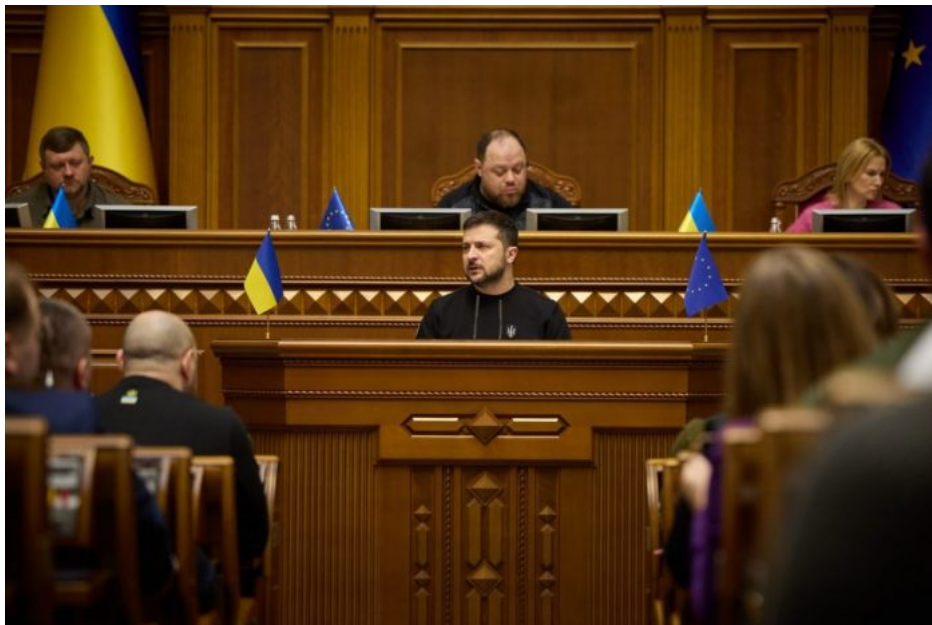
Zelenský bude od 21. května nelegitimním prezidentem Ukrajiny

A vzhledem k tomu, že Zelenskému končí 20. května prezidentský mandát a od 21. května bude de facto bossem podsvětí v čele Ukrajiny a nelegitimním silovikem , tak pravděpodobnost racionálního myšlení ve vedení Ukrajiny se bude limitně blížit nule. Jinými slovy, před Ruskem leží budoucnost, kdy Ukrajina se nikdy nevzdá myšlenky na členství v NATO, přičemž Západ přijme Ukrajinu do NATO ve chvíli, kdy na Ukrajině utichnou zbraně. To je jednoduchá rovnice. Kdokoliv si myslí něco jiného, je na omylu.