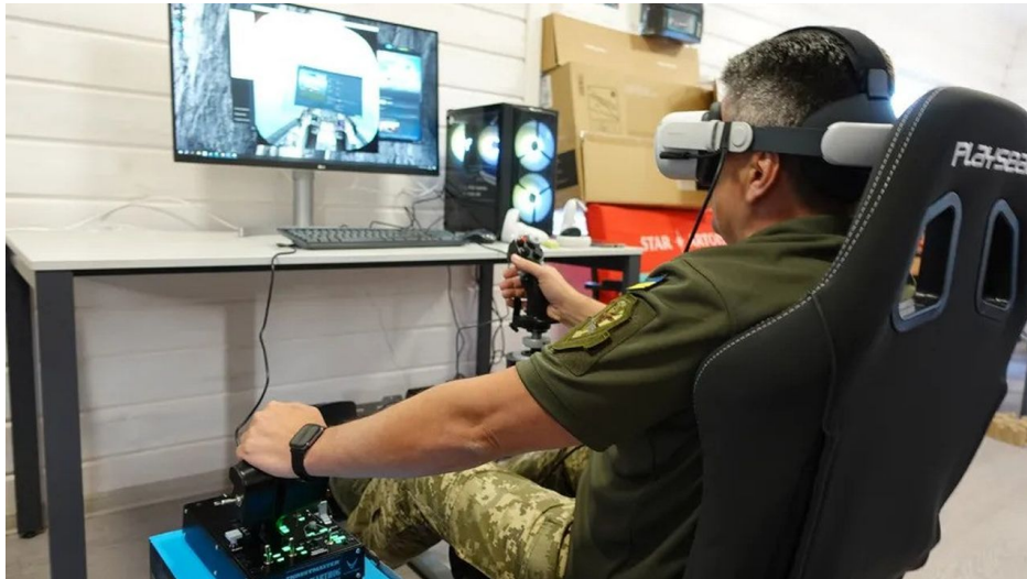
Výcvik ukrajinských pilotů F-16 na simulátoru virtuální reality

Je tak náročná, že se de facto už otevřeně mluví o tom, že s těmi stíhačkami budou na Ukrajině létat západní veteráni, tedy vojenští piloti v záloze, kteří zřejmě podepíší s Ukrajinou žoldáckou smlouvu. A až nějaký ten pilot se nad Donbasem katapultuje, tak Rusové se od něj dozví, že výcvik na F-16 trvá normálně 3,5 roku, ale tolik času Ukrajinci nemají, takže místo nich létají nad Ukrajinou v těch F-16 piloti země NATO. Musíte pochopit, že když už i ukrajinský premiér na kanadské televizi oceňuje a vítá Macronův nápad na rozmístění vojsk nejen Francie na území Ukrajiny, tak už i českým redaktorům mainstreamu dochází, že selanka s ukrajinskými vlaječkami a s peremogou definitivně skončila.