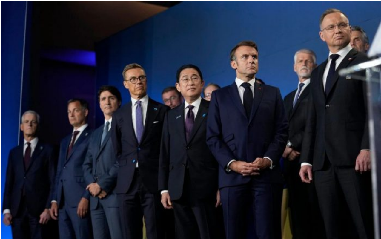
Zděšené a zachmuřené pohledy představitelů zemí NATO na Bidenův výrok o Putinovi

To je součást plánu globalčiků a tyto epizody Joe Bidena pouze utvrdí evropské elity, že vybírat si snad mezi závislostí EU na USA vedenými demenčním Bidenem, anebo závislostí EU na USA vedenými “ pro-ruským ” Trumpem, nemá prostě smysl a dovede je to zpátky k myšlence vytvoření tzv. Evropské armády. Vznikem EU armády bude rozborka NATO dokončena. A mezitím globální jih začne upevňovat svoji dominanci. Naprostým šokem byla asi nejen pro mně informace, že Vladimir Putin prohlásil [2], že skupina BRICS by měla vytvořit svůj vlastní parlament, tedy vlastně legislativní orgán na způsob Evropského parlamentu a jeho předchůdce Nejvyššího sovětu a Sjezdu lidových poslanců v dobách SSSR.