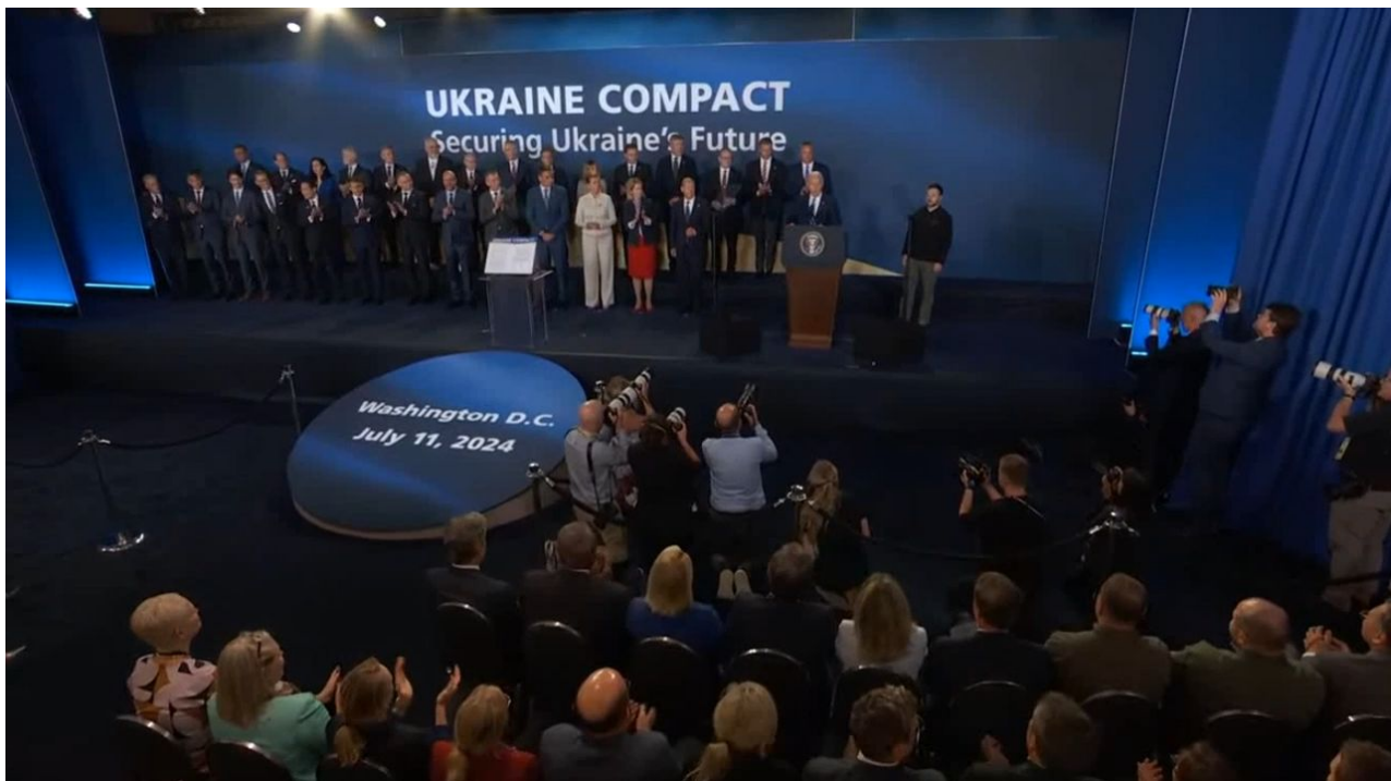
Pódium závěrečného aktu summitu NATO ve Washingtonu

Taková země chce vést ekonomickou a konceptuální válku proti zemím globálního jihu zastřešenými mamutím komplexem BRICS? Ne, všechno tohle, co se děje okolo Bidena, je součástí plánu globalistů na odpis USA, a to v přímém přenosu a takovým způsobem, aby to viděly masy a davy lidí celého světa, aby se USA znemožnily a odepsaly úplně samy, bez jediného válečného výstřelu, prostě aby se ukončily zevnitř a nebylo o tom pochyb.