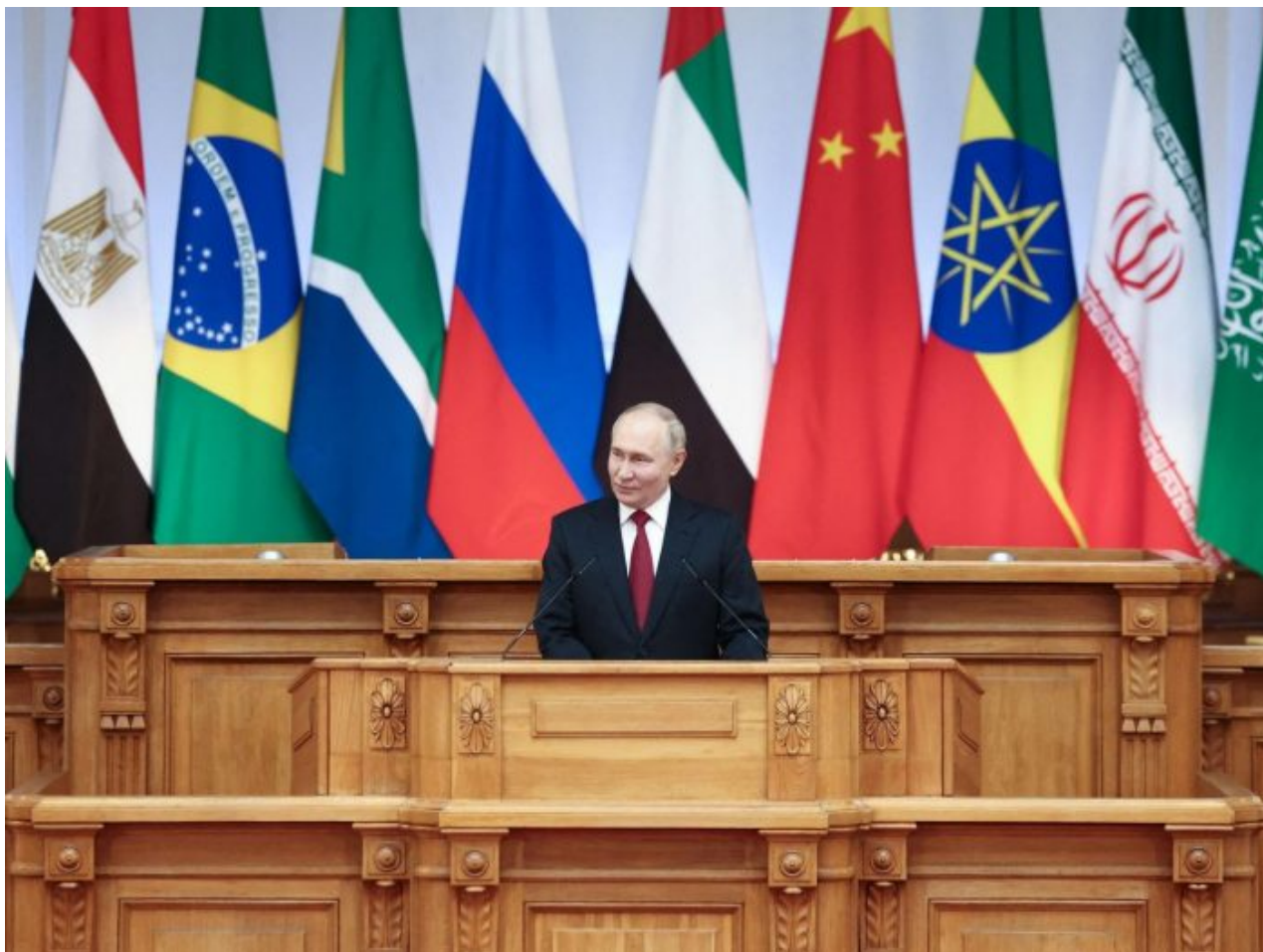
Vladimir Putin na parlamentním fóru skupiny BRICS v Petrohradě

Skupina rozvojových ekonomik by měla jednat společně, aby posílila svůj globální vliv, uvedl ruský prezident. Členové ekonomické skupiny BRICS by v budoucnu mohli založit vlastní parlament, prohlásil ve čtvrtek ruský prezident Vladimir Putin na desátém parlamentním fóru tohoto bloku v Petrohradě. Ruský vůdce poznamenal, že počet účastníků se letos zvýšil. Uvedl, že Rusko jako současný předseda skupiny zintenzivní své úsilí, aby zajistilo účinnou integraci čtyř nových členů bloku po jejich letošním vstupu. BRICS založily v roce 2006 Brazílie, Rusko, Indie a Čína, Jihoafrická republika se připojila v roce 2011.