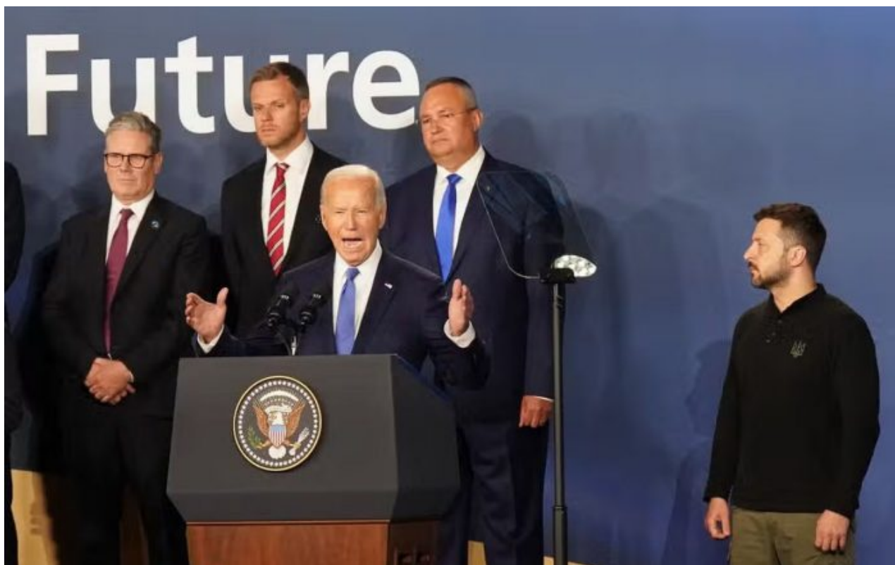
Zelenský zírá na Bidena, když ho přivítal jako Vladimira Putina

používání amerického dolaru a eura pro obchodní vypořádání. Podíl národních měn na vypořádání Ruska se zeměmi BRICS vyskočil na 85% na konci roku 2023 z 26% před dvěma lety. Celý blok BRICS se odpoutává od bývalého projektu globalistů SWIFT, který ovládl americký národní prediktor. A výrok Putina o tom, že politická institucionalizace BRICS bude v budoucnu určitě realizována, je pouze potvrzením rukopisu globalistů.