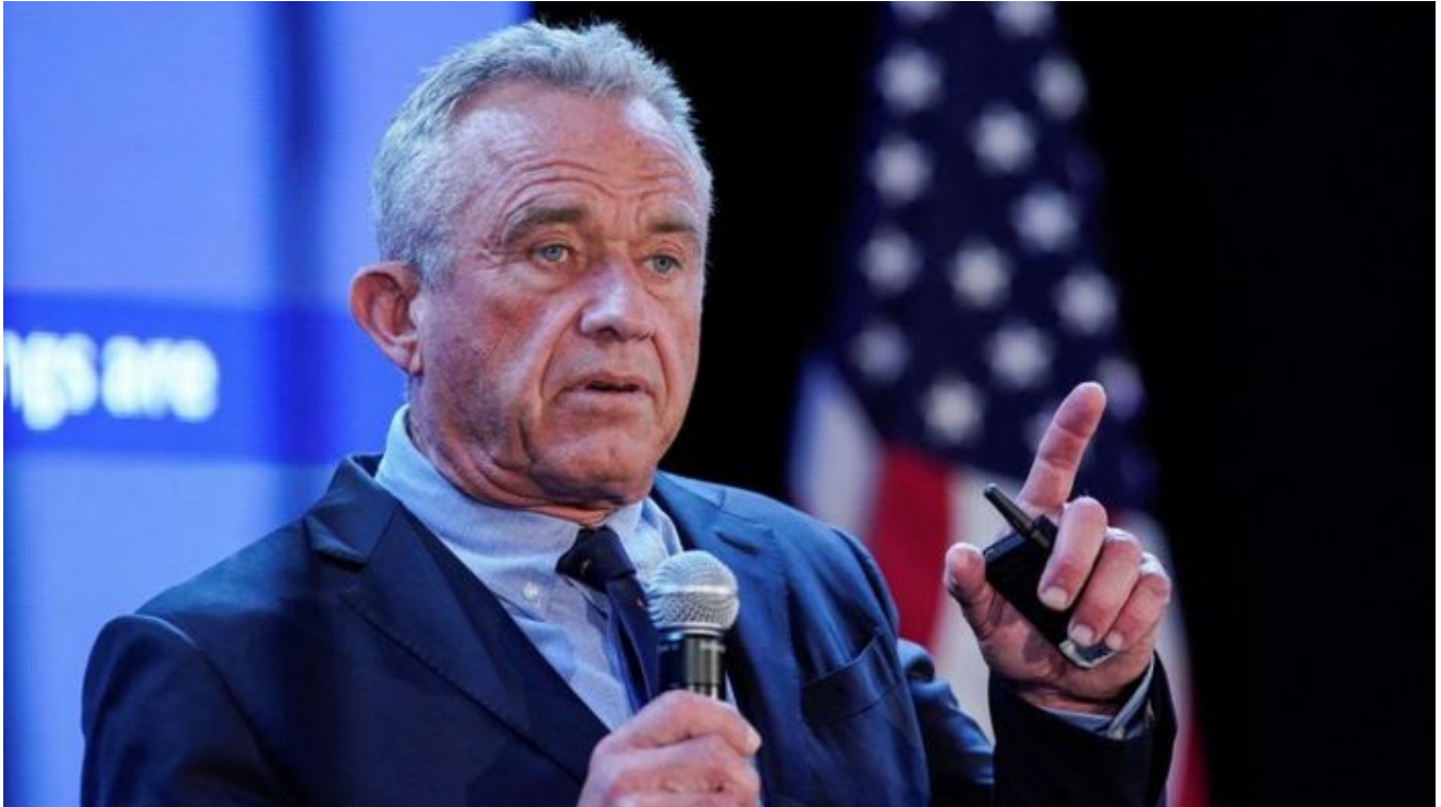
Robert F. Kennedy

Odstoupení Joea Bidena z kampaně je ovšem velice riskantní tah, protože Biden má dlouhodobě mezi voliči demokratů nejvyšší preference, zatímco ostatní kandidáti zůstávají daleko pozadu, a to se týká především vysoce neoblíbené viceprezidentky Kamaly Harrisové, jejíž podpora se pohybuje okolo 17% přesvědčených voličů mezi demokraty.