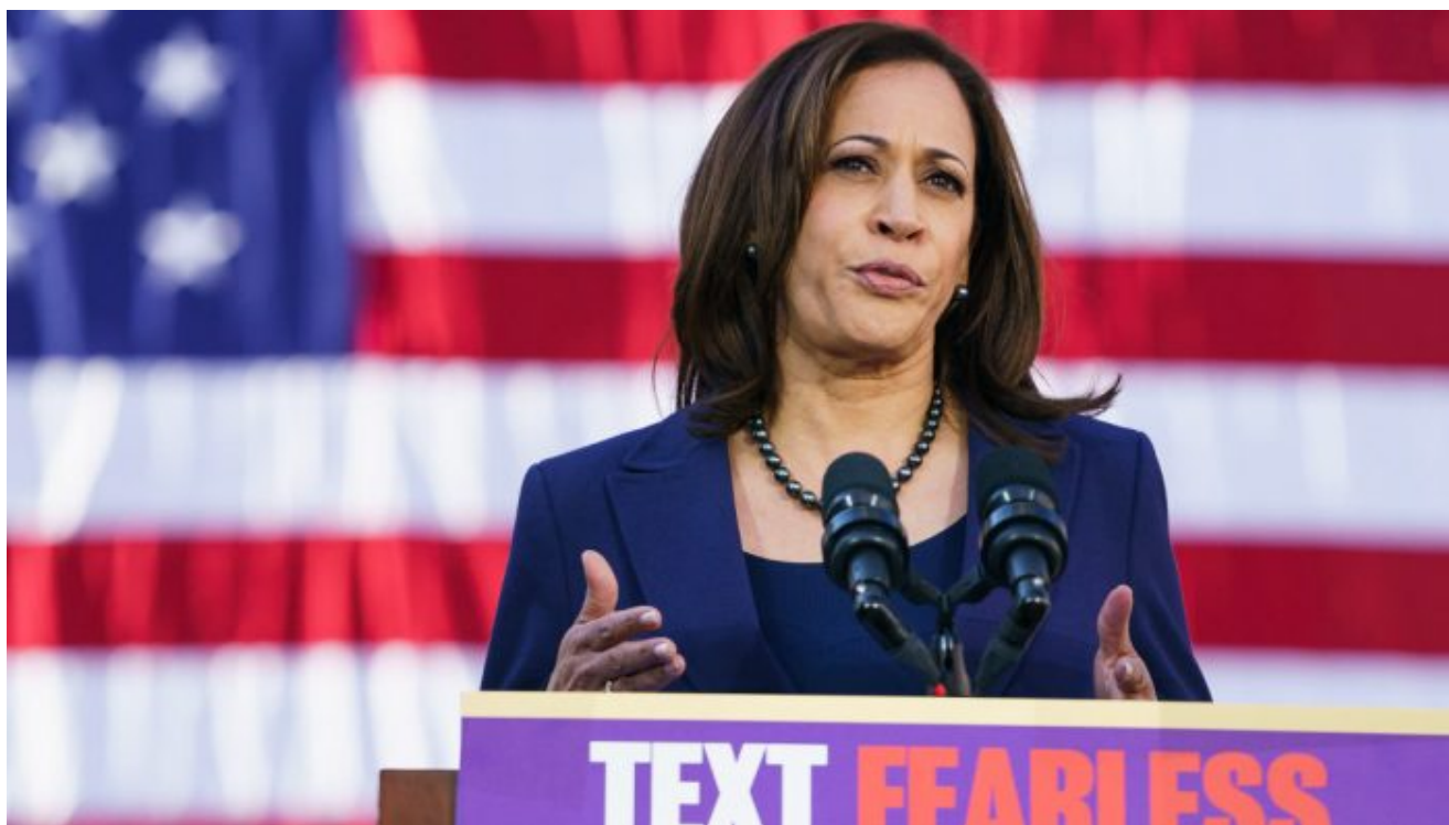
Kamala Harris, viceprezidentka

Halperin v pořadu FRONTLINE uvedl, že mezi možnými partnery Harrisové jsou guvernér Kentucky Andy Beshear a guvernér Pensylvánie Josh Shapiro. Ve svém příspěvku na X zmínil, že Beshear a Shapiro jsou mezi čtyřmi možnými kandidáty. Přední demokraté, včetně bývalého prezidenta Baracka Obamy, údajně na Bidena naléhají, aby si svou kandidaturu proti bývalému prezidentovi Donaldu Trumpovi rozmyslel.