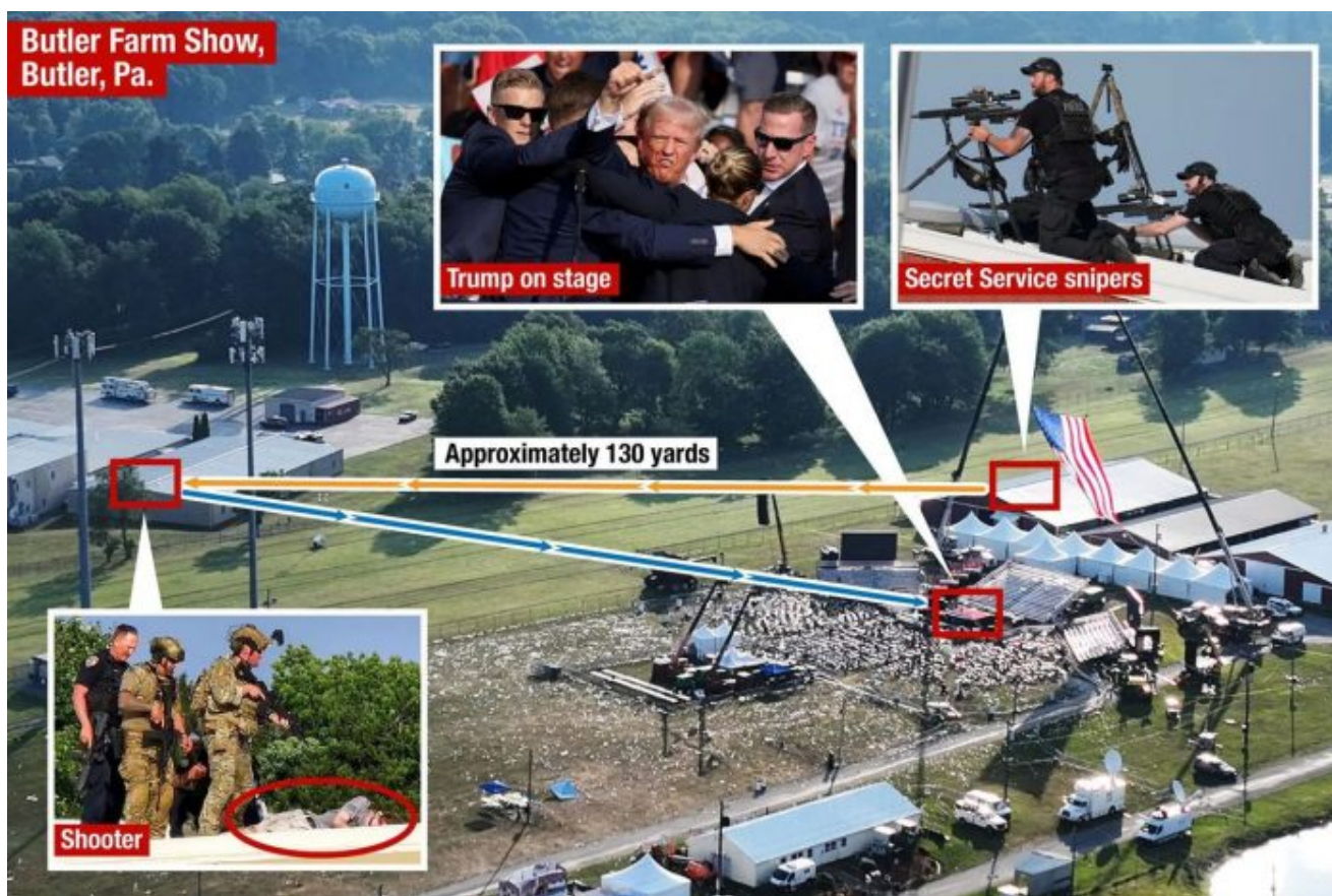
Pozice vodárenské věže

zhruba 150 metrů. Bylo naprosto jasné, že musel střílet profesionál s optikou. Právě proto zvuková analýza publikovaná CNN potvrdila, že na místě události zazněly výstřely z celkem ze 3 zbraní.