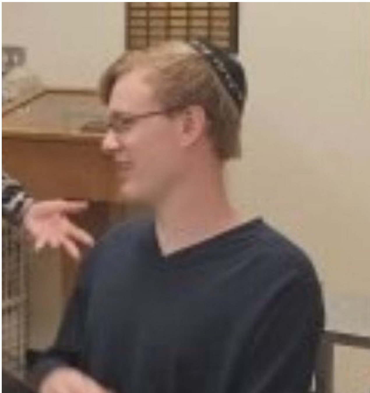
Fotografie Thomase z místní ješivy v Bethel Parku z Facebooku střelce z dřívější doby

Crooksovi bylo 20 let a pocházel z Bethel Parku v Pensylvánii, který se nachází asi 40 mil jižně od Butleru a Trumpova shromáždění. Na místě činu byla údajně nalezena puška AR-15, ale bez optického zaměřování, což překvapilo i zasahující policisty.