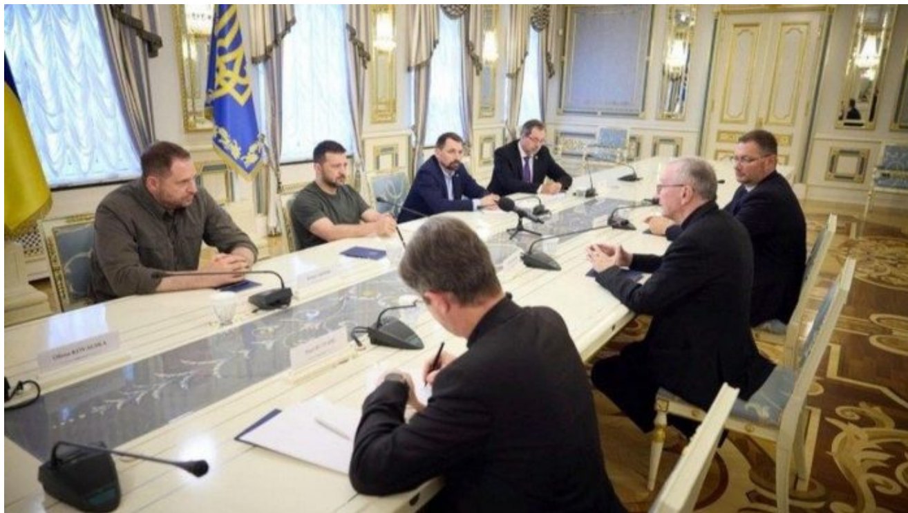
Delegace Vatikánu v Kyjevě se Zelenským

Během své cesty kardinál navštívil města Lvov, Oděsa – kde si prohlédl katedrálu zničenou před rokem raketovým útokem – a Kyjev, kde navštívil dětskou nemocnici Ochmatdyt, která se stala centrem dezinformační provokace, ve které účinkovali lékaři v pláštích, na které si malovali červenou barvou krev. Videá unikla na sociální síť.