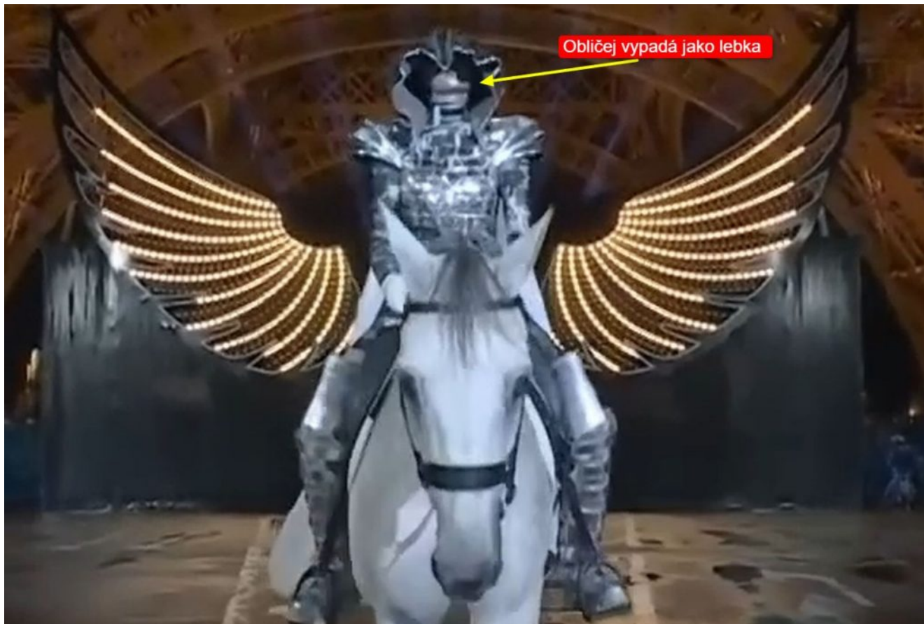
Lebka místo obličeje

Když jezdec vyjíždí z pod Eiffelovy věže a dochází k zajímavé optické iluzi, kdy dvě křídla umístěná na nosném oblouku věže vypadají, jako kdyby to byla křídla koně, tak v tom okamžiku mně zarazil obličej jezdce, který vypadal jako lebka, resp. spodní a horní čelist bílé lebky. Podívejte se na video a na fotografii výše, to prostě není obličej člověka, vypadá to doslova odporně a děsivě. Je to buď maska kostlivce, kterou si jezdec později mimo záběr sundal, anebo šlo o předtočenou sekvenci jezdce s maskou kostlivce pro diváky televize, kterou ale přímí účastníci neviděli.