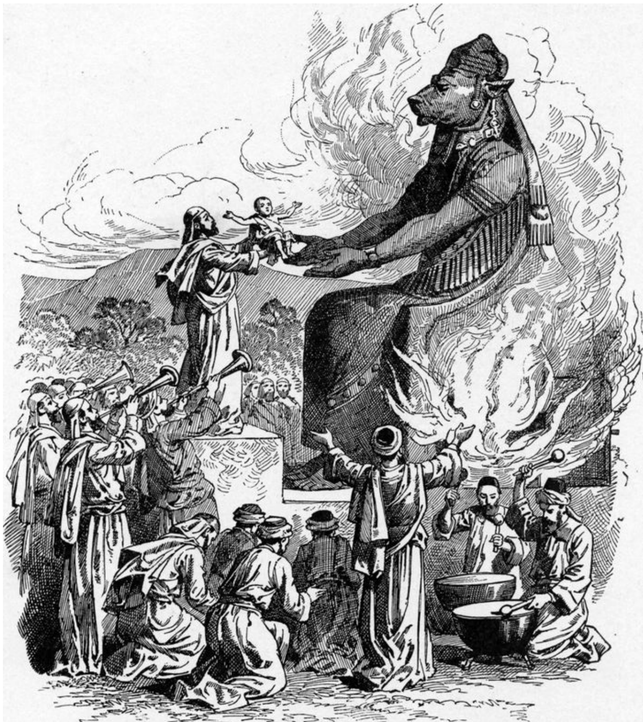
Malba Charlese Fostera – Obětování Molochovi

K dnešnímu dni ve světě existuje 195 zemí světa. A jedna čtvrtina je necelých 49 zemí. Přesně tolik je zemí Kolektivního Západu, jejichž počet se standardně zaokrouhuje na 50 zemí. To je přesně ta