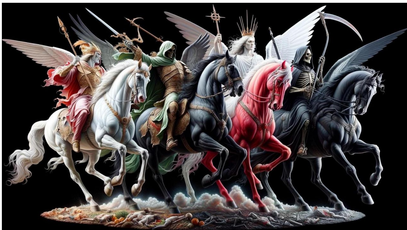
Čtveřice jezdců Apokalypsy

Video naprosto jasně zde odhalilo, že kůň opravdu nebyl bílý, ale měl podivnou šedou a jakoby mrtvolnou barvu, přesně takovou, která je popsána v Bibli o koni, na kterém vyjíždí 4. jezdec Apokalypsy a jeho jméno je Smrt. Tento jezdec je nejen v církevních kresbách a malbách zobrazován prakticky pouze jako kostlivec, resp. smrtka s kosou jedoucí na koni šedivé barvy.