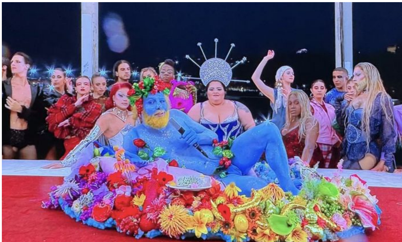
Perverzák na talíři na stole Poslední večeře Páně. Vlevo stojící muž se šourkem vylezlým z boxerek

Všechno toto, co předvádí Mezinárodní olympijský výbor, je prostě deviatura . MOV je organizace, řekl by jeden, plná úplně samých úchylů a perverzních deviantů. Posud'te sami: Modře namalovaný a skoro nahý chlap v míse s jídlem na stole připomínajícím Poslední večeři Páně a při zpěvu točí penisem jako vrtulí.