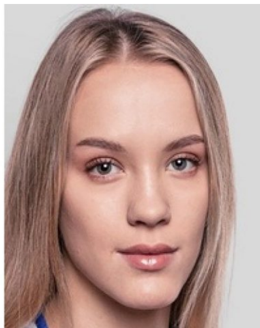
Statistiky ruské boxerky

V řece Seině plavou exkrementy, kondomy, splašky a, plavou tam krysy a mezi tím vším plavou závodní plavci, kteří už po plavání skončili v nemocnici v Paříži. Nákaza splaškovou bakterií E.coli. Francouzský tisk napsal [2] toto: Přívalové deště mohou přetížit zastaralý kanalizační systém města a způsobit únik neupravených odpadních vod do řeky Seiny, což zvyšuje výskyt bakterií E. coli. V letech před olympijskými hrami v Paříži vynaložila Francie více než 1 miliardu dolarů na vyčištění řeky Seiny, ve které se již více než sto let nesmí koupat.