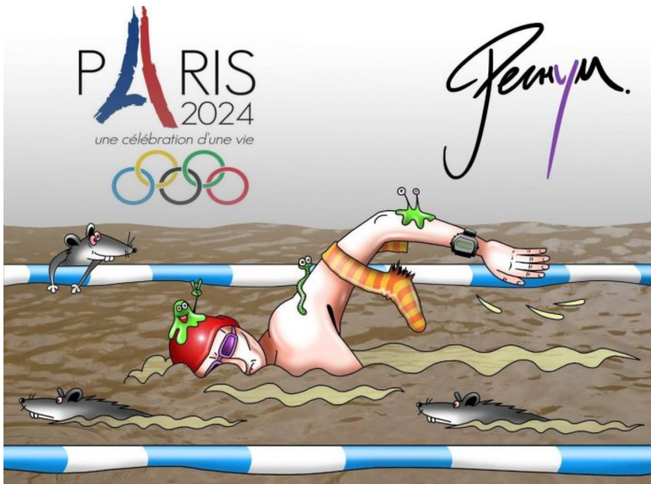
Meme vystihující kvalitu olympijského plavání ve vodě v Seině

Ano, stačil jeden silnější déšť během zahajovacího ceremoniálu a vyčištění Seiny za 1 miliardu USD vyšlo nazmar. Do řeky ústí mnoho kanálů pod Paříží, které byly vybudovány dávno před Francouzskou revolucí v roce 1789, mnoho těchto kanálů ústí do Seiny napřímo, bez jakéhokoliv přefiltrování v čističce odpadních vod. Pařížská radnice to prý vyřešila tak, že asi stovku výpustí zazdila, tedy ty, které nejdou přes čističky. Jak se ale ukazuje, přepadová soustava kanálů funguje tak, že když začne pršet, a to jako hodně, přepadové bariéry přetečou a splašková voda teče rovnou do Seiny.