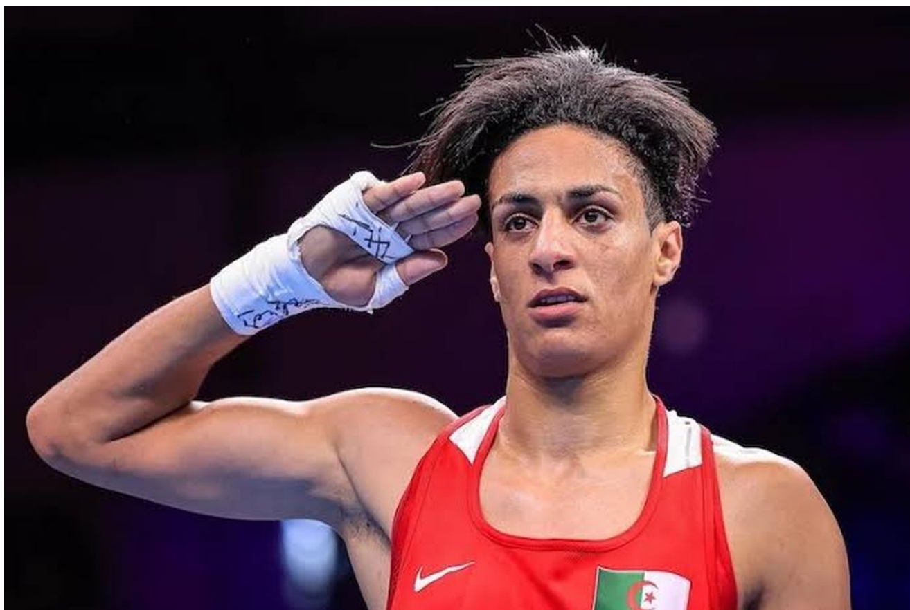
Imane Khelif prohlašující se za ženu a boxující na LOH 2024 v ženské kategorii lehké váhy

Právě proto globalisté hromadně od 90. let nahradili veškeré nápojové skleněné lahve za plastové, ze kterých se uvolňují mikroplasty nepřetržitě do potravinového řetězce. A nejen plasty. Ještě horším než mikroplast je hliník v organismu, který se do těla dostává třeba dlouhodobou konzumací nápojů z hliníkových plechovek.