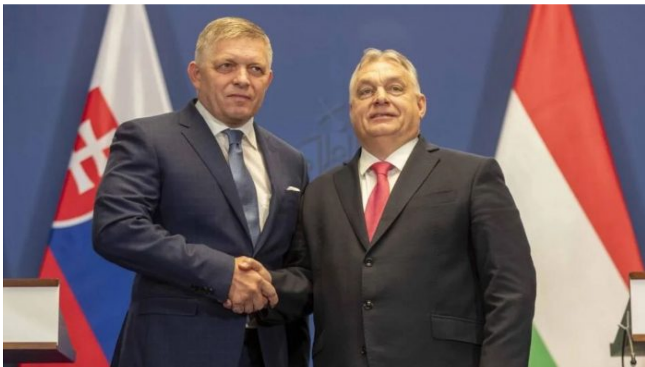
Robert Fico a Viktor Orbán

Rozumím tomu, že Robert Fico po uličním sórošovském převratu v roce 2018 na Slovensku potřeboval oslovit nové voliče, protože nemalá část těch starých mu odešla do liberálně příkloněného a od SMERu odtrženého Hlasu pod vedením Petera Pellegriniho. A ty nové voliče skutečně našel mezi tzv. nesystémovými voliči na alternativě a na tzv. vlastenecké scéně.