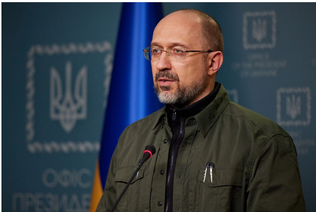
Denys Šmyhal, premiér Ukrajiny

Minulý měsíc jsme publikovali článek [1] o informacích našeho zdroje, který nám poskytl údaje a podrobnosti o tom, že zastavení ropy a utažená kohoutů na Ukrajině proběhlo nejen na podnět amerického ministerstva zahraničí v odvěť za Orbánovu návštěvu u Putina v Kremlu, ale dokonce s přímým souhlasem a ve spolupráci s Evropskou unií, konkrétně jistou osobou z Evropské rady. Informaci nyní potvrdil i ukrajinský premiér Denys Šmyhal.