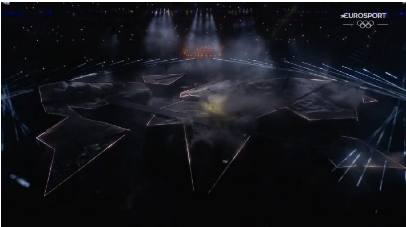
Kontinenty planety Země. Sluneční Bůh Amon-Ra kráčí k pramenům Nilu

Volba na ně padla podle všeho náhodně. Příímá krevní linie po Nephilim vychází od Abraháma v linii Amšelach Charedim a tato linie vychází přímo z Egypta. Útěk Židů z Egypta nebyl podle egyptských okultistů útekem, ale evakuací před morovou ránou v Egyptě. Pokrevní linie po Nephilim musela být ochráněna. Vyvolený národ je úzce spojen s Egyptem a s okultními procesy z dob vlády Bohů v Karnaku. Není překvapením, že globalisté uctívají Egypt.