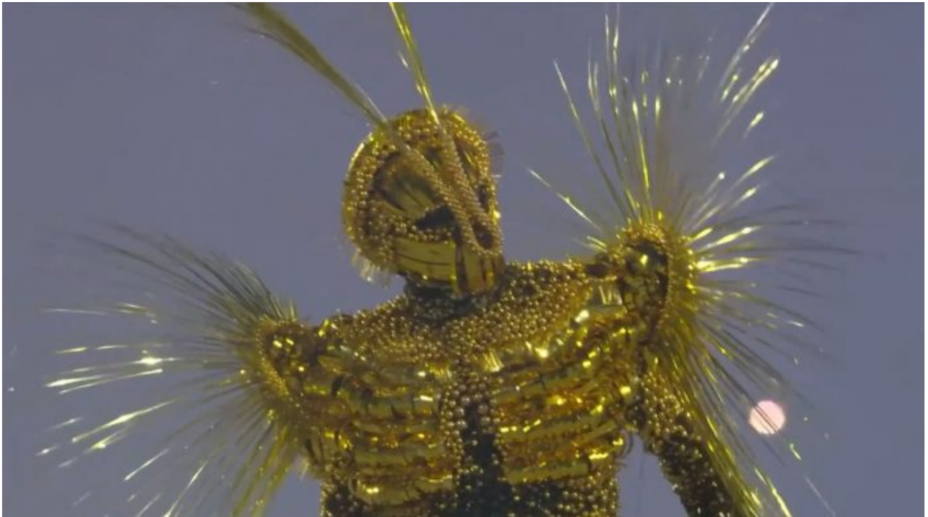
Sluneční Bůh Amon-Ra

zahajovacího ceremoniálu a další prvky deviatury. Jenže, všechno bylo jinak a popravdě řečeno, globalisté se vrátili ke kořenům a tento nedělní spektakl [1] většina pozorovatelů vůbec nepochopila, případně analyzovala ceremoniál chybně. Autoři ceremoniálu přitom šokovali plakátem, který zval lidi na celou nedělní akci. Plakát zobrazoval žlutou postavu padající z vesmíru hlavou dolů k planetě Zemi.