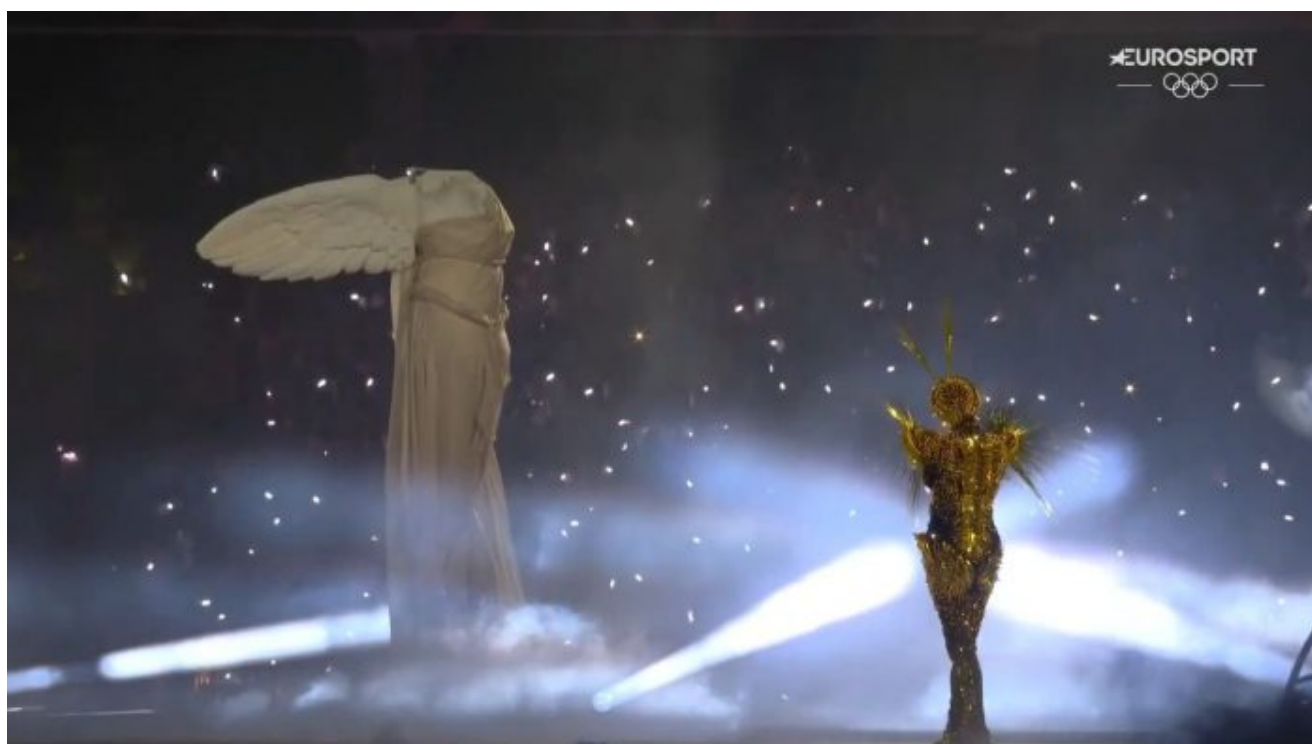
Amon-Ra sleduje bezhlavou Isis, které sťal hlavu její syn Horus

před sebou. Ano, je to bohyně Isis, žena Osirise, Boha podsvětí, svržená do podsvětí, je matkou Boha Hora, který je Bohem nebes. Horus podle okultní egyptologie kvůli sporu usekl svému matce Isis hlavu a svrhl jí do podsvětí do Říše mrtvých. Isis byla ovšem nesmrtelná, nezemřela a vrátila se z hlubin zpět, ale bez hlavy. Tu si musela potom kouzlem navrátit zpět, ale až později. A při ceremoniálu vidíme, jak sluneční Bůh Amon-Ra sleduje Isis bez hlavy stoupat z hlubin podsvětí zpátky do světa živých.