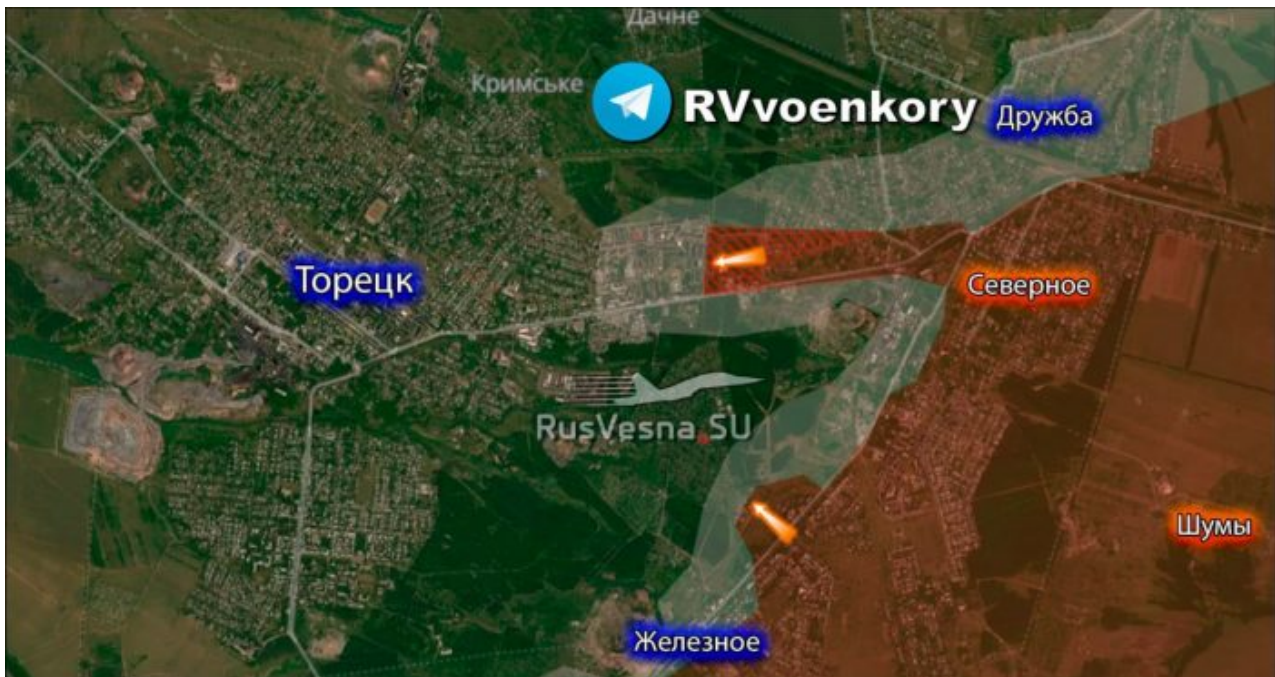
Ruská armáda vstoupila do východní části Torecku

multipolarity. Samotným kolektivistům ale Total Control ponechá kontrolu nad západním prostorem, nad svými goyim . Prostě rozborka světa. Rozborka upravljena .