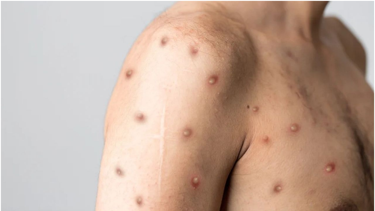
Příznaky opičích neštovic

chemtrails na modifikaci počasí, kdo těm zmetkům zabrání, aby nerozprašovali i něco jiného? Zkuste se zamyslet. Doba inkubace až 17 dní je dostatečnou dobou na to, aby někdo roznesl opičí virus po Evropě, třeba skupinka migrantů z prostoru Sahelu, tomu se prostě nedá vyhnout, pokud to budou zapadčičky ve spolupráci s globálním direktorem/prediktorem chtít realizovat.