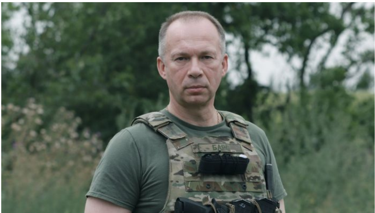
Vrchní velitel AFU gen. Alexander Syrský

Jak sami vidíte, nad krokem generála Syrského krouť hlavou i analytici Financial Times, protože celé to můžeme shrnout řečnickou otázkou: Proč by Moskva stahovala z Donbasu svá vojska, když poprvé po 2,5 letech tam postupuje bez odporu díky Syrskému, který vyklidil ukrajinská opevnění? Chápete? A můžeme si položit ještě další provokativní otázku: Opravdu by Kreml neposlal do Kurské oblasti potřebnou a stejně početnou kavalérii, kdyby Moskva měla opravdu obavy, že hrozí vážně míněná invaze? Prostě celé to začíná smrdět jako spiknutí, dámy a pánové.