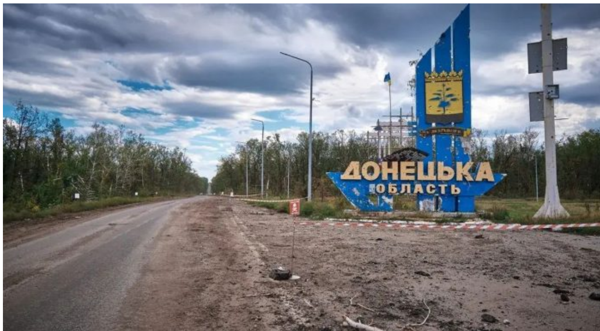
Doněcký mural na ukrajinské straně Doněcké oblasti

Ruská armáda poprvé po dvou a půl letech začala postupovat na Doněckém směru takovou rychlostí, jako nikdy předtím. Dokonce i český fialový mainstream bije [1] na poplach. Jedná se přitom o absolutně nejtěžší úsek celé a více než 1 000 km dlouhé fronty, kde AFU postavila od roku 2014 do počátku roku 2022 největší komplex opevnění na světě.