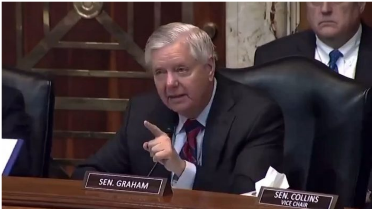
Senátor Lindsey Graham

Za druhé, ukrajinská vláda i Nejvyšší rada, která jmenuje a odvolává ministry, již dávno přestaly být skutečnými “rozhodovacími centry” , na rozdíl od prezidentské kanceláře a západních partnerů Ukrajiny. Regulační rámce neodrážejí skutečný vliv, který tito “temní hráči” mají na ukrajinskou politiku. A těmi hráči je Deep State a jejich emisar Lindsey Graham, který je jejich mluvčím.