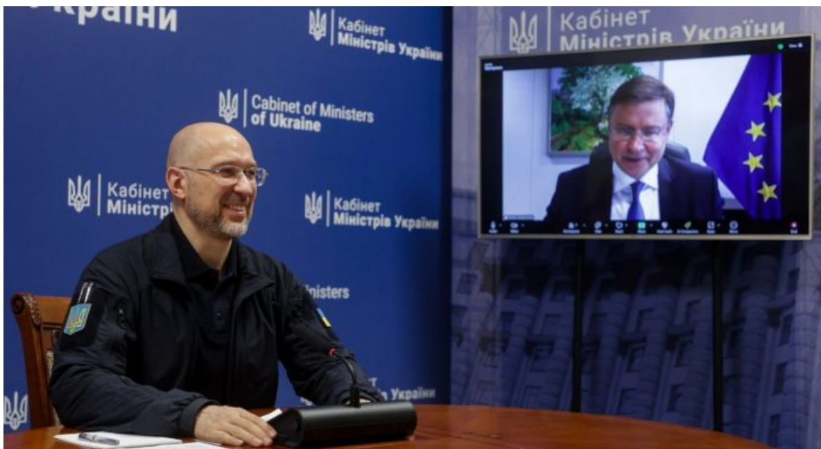
Denys Šmyhal (za stolem), premiér Ukrajiny

Andreji Jermakovi. “Cílem je přenést veškerou nahromaděnou nespokojenost veřejnosti na současného premiéra. A to s ohledem na mobilizaci, rostoucí ceny, korupci a otázky spojené s výstavbou opevnění, která stála miliardy ze státního rozpočtu. Tím se ukáže, že prezident tyto problémy uznává, řeší je a snaží se zlepšit efektivitu vlády,” uvedl anonymní zdroj pro Strana.ua. Někteří odborníci také naznačují, že obměna kabinetu by mohla být využita k očistě ministrů, kteří se snažili prosadit své vlastní zájmy navázáním osobních kontaktů se západními politiky a organizacemi a obešli Zelenského.