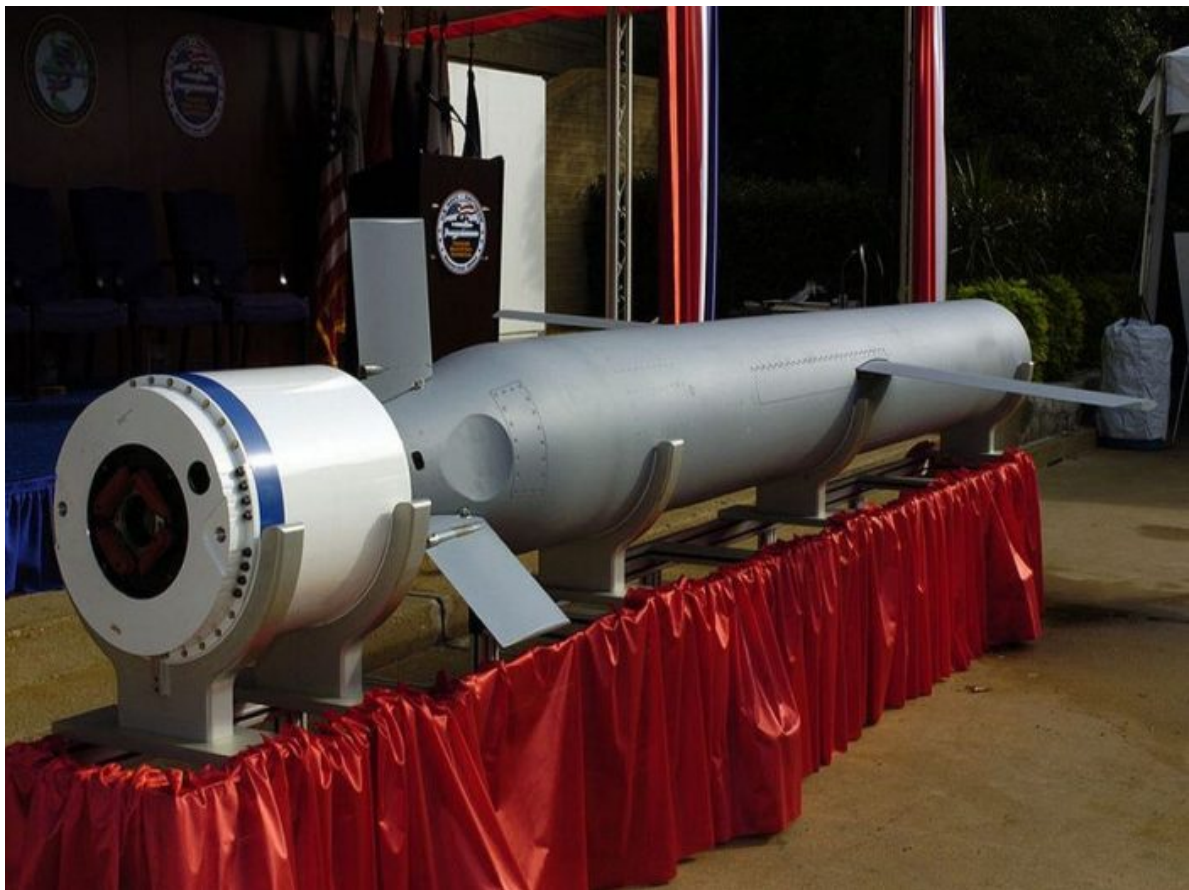
Raketa Tomahawk s krytem proudového motoru

Všechno, co se teď děje v Kyjevě, je snaha o poslední zázrak, kterým má být použití raket dlouhého doletu proti Rusku, a rovnou se hovoří o raketách s plochou dráhou letu Tomahawk s doletem skoro 2,5 tisíce km, čímž by se na dostřel dostalo město Ťumeň až za Uralem. Tyto křídlaté americké rakety přitom mají schopnost nést jaderné hlavice. Není to Zelenský, který se snaží zatáhnout USA a NATO do války s Ruskem.