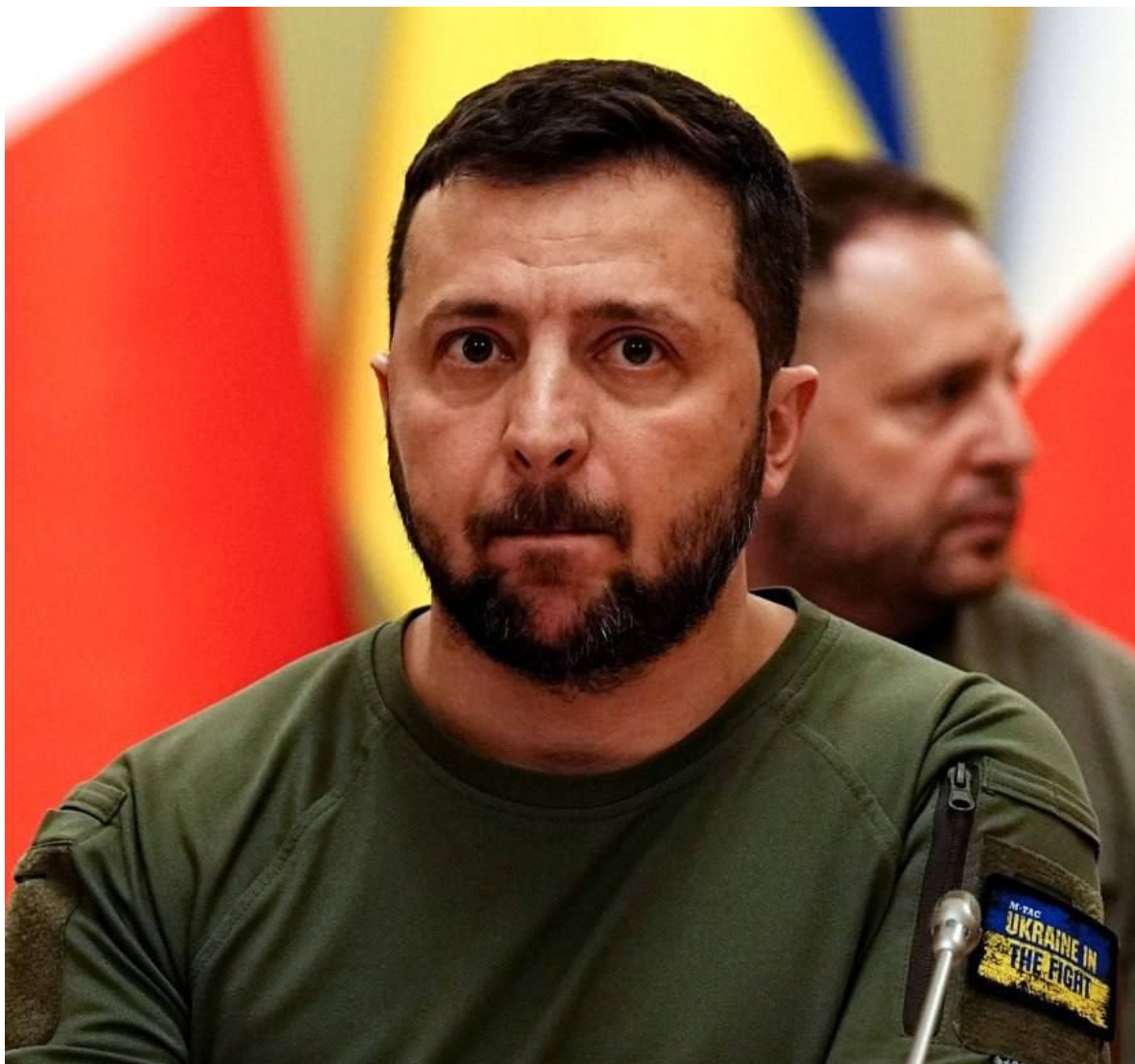
Ňuchačenko na tripu

V projevu den před summitem ve Švýcarsku ruský prezident Vladimir Putin řekl, že podmínkou mírových jednání je, aby se Ukrajina plně stáhla ze čtyř částečně okupovaných oblastí, které Moskva anektovala v roce 2022. Kyjev tento požadavek odmítl. Kreml zase odmítl klíčovou podmínku Ukrajiny v Zelenského desetibodovém mírovém vzorci o úplném stažení ruských sil. Republikánský kandidát v amerických prezidentských volbách Donald Trump opakovaně přislíbil ukončení války do 24 hodin, což by mohlo podle některých zpráv zahrnovat donucení Ukrajiny k odstoupení území.