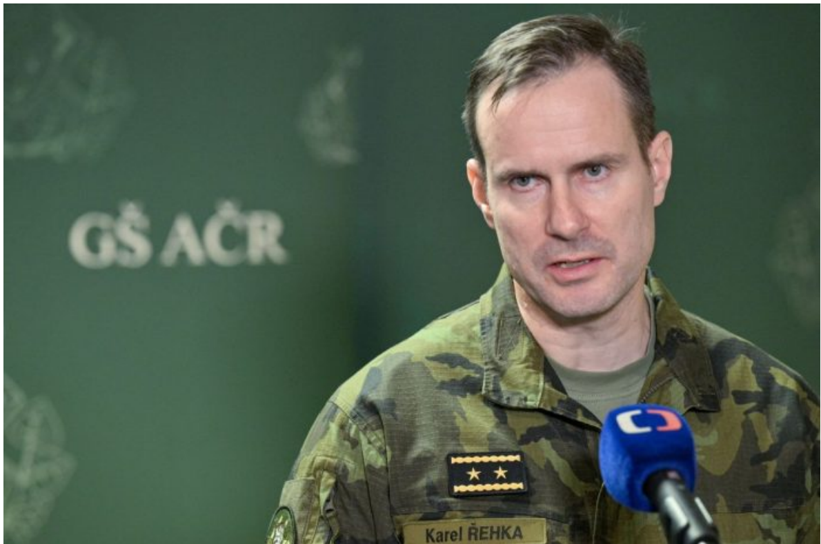
Náčelník GŠ AČR Karel Řehka

V Česku už dokonce náčelník genštábu Karel Řehka prohlásil [3], že Ruska není potřeba se bát, protože ruské hrozby jsou jen slova, ale Putin jinak nic neudělá. Ano, je to přesně tak. Deep State si ověřuje, že Rusko se podle všeho bojí a zdráhá udeřit na země NATO, takže sázky o Ukrajinu se tím pádem navyšují a spolu s tím i odvaha vyzkoušet na Rusy i strategické rakety s plochou dráhou letu, a když to bude nutné, tak i jaderné taktické zbraně.