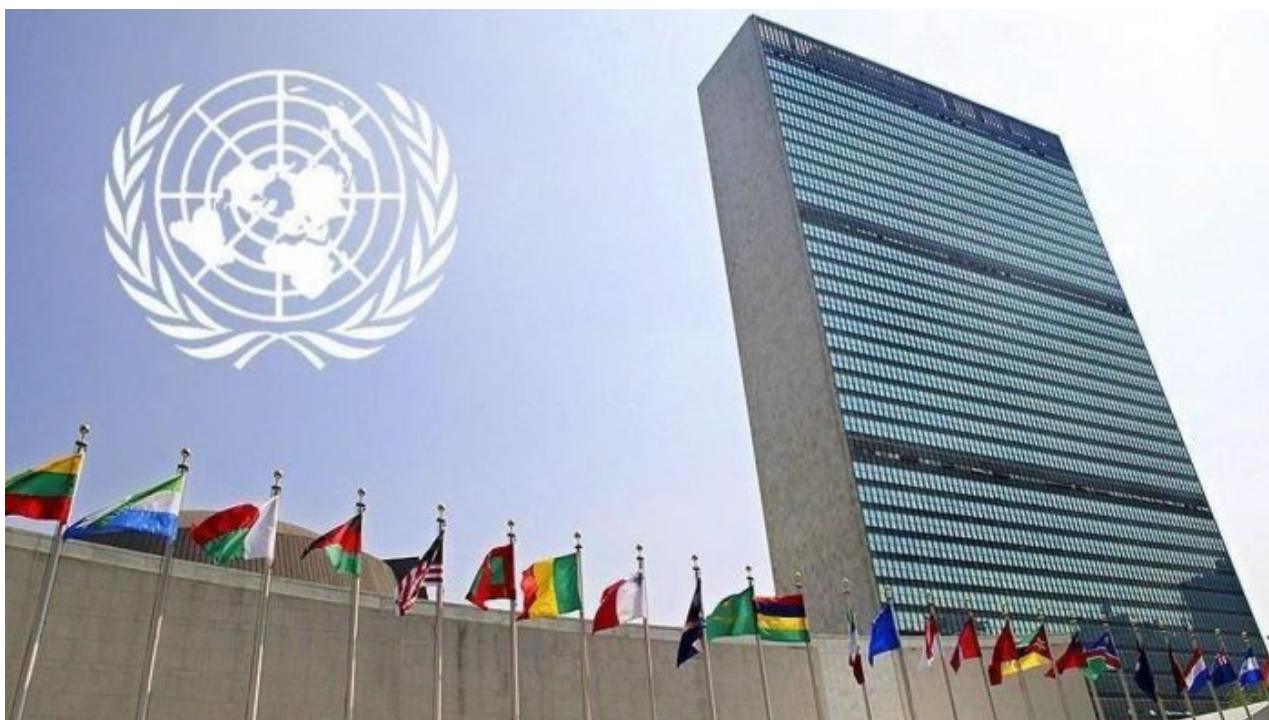
Sídlo OSN v New York City v USA

Mezinárodní snaha o propagaci dětské pornografie není nová. Před několika lety UNICEF vydal a později pod tlakem odvolal zprávu [4], podle níž může být pornografie pro děti prospěšná. Po přijetí nového znění smlouvy zůstalo několik delegací nepřesvědčených a znovu vyjádřilo své obavy z mezer ve smlouvě, včetně Nikaraguy, Nigeru, Džibuti, Pákistánu, Papuy-Nové Guineje, Iráku, Guatemaly, Mali, Tanzanie, Venezuely, Thajska, Sýrie, Burkiny Faso, Paraguaye, Senegalu, Maroka, Súdánu, Ugandy, Keni a Zimbabwe a především Ruska.