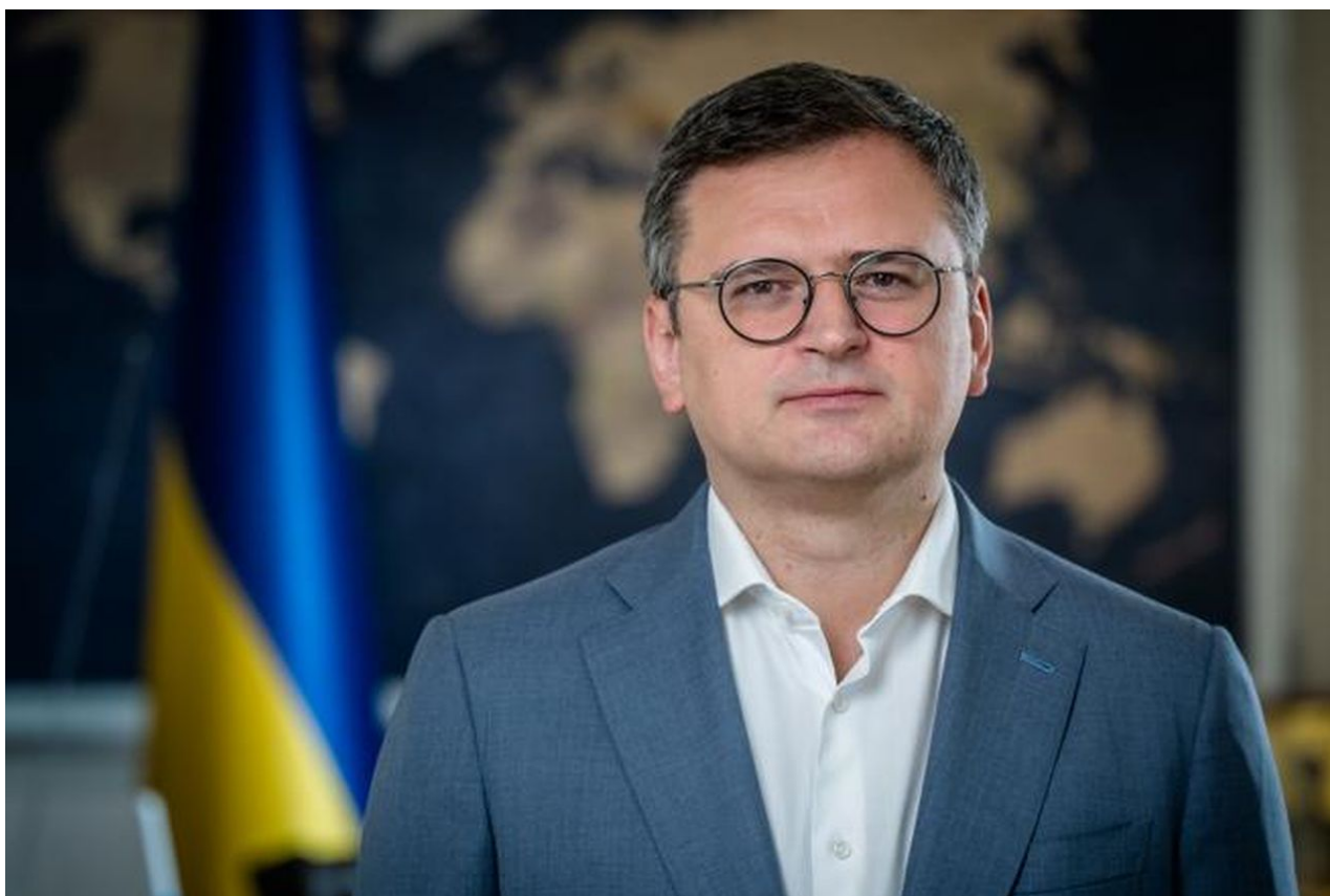
Dymtro Kuleba rezignoval na funkci ministra zahraničí Ukrajiny

Nebo jaký signál by to vyslalo do Gruzie, která je ve sporu s Ruskem o Jižní Osetii a Abcházii. Prostě Rusko nemůže na tento styl kšeftování přistoupit ani v případě, že by se původní plán Kyjeva povedl a opravdu by AFU obsadila hlavní města obou zmíněných ruských pohraničních oblastí. Ohrozilo by to totiž integritu Ruska a podnítilo další země ke stejnému postupu k Rusku, tedy ve smyslu, že napadneme někde slabě chráněnou ruskou hranici, no a potom to území vyhandlujeme za něco, co nám Rusové nebo před ním Sovětský svaz obsadili.