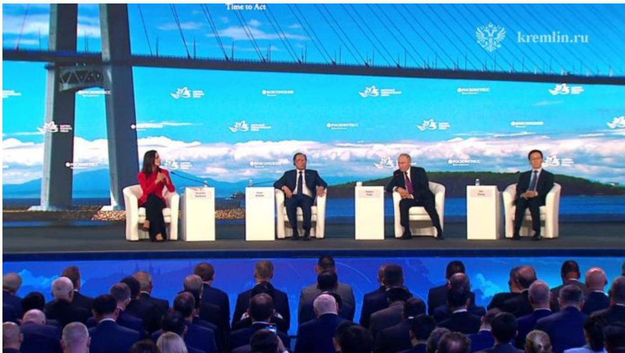
Vladimir Putin na Východním ekonomickém fóru VEF 2024

způsobem tak bylo vytvoření tzv. rošády, tedy šachového gambitu, kdy Ukrajina vrhne do slabě bráněné Kurské oblasti poslední zbytky svých použitelných úderných sil, obsadí v bleskové invazi hlavní město oblasti Kursk společně s jadernou elektrárnou v Kurčatově kousek od Kursku, a tento bleskový scénář měl být zopakován i vedle v sousední Belgorodské oblasti, kde mělo být obsazeno hlavní město oblasti Belgorod.