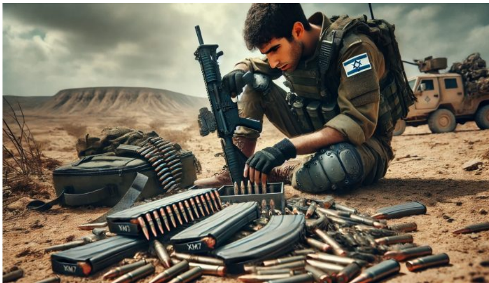
Invaze IDF do Libanonu bude roznětkou k Velké válce na Blízkém východě

Přímý zásah Spojených států do války v Libanonu totiž otevírá cestu k válce v celém regionu: pak bychom byli jen půl kroku od vstupu Íránu a zahájení izraelsko-iránské a následně íránsko-americké války. V jejím průběhu – jak o tom Netanyahu a američtí jestřábi jako Bolton sní už léta – by Amerika vybombardovala Írán zpět do doby kamenné.