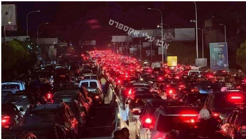
Záběry z evakuace Libanonců z Bejrútu

Jak již uvedl [2] pro ruský server RIA Novosti analytik Pjotr Akopov, útok na pagery v Libanonu byl předejrou k velké válce – a v pondělí skutečně začala. Izrael začal bombardovat města a silnice v jižním Libanonu – což v podstatě znamená přípravu na pozemní invazi. Jen za první den bylo zabito asi 300 lidí, proudy uprchlíků se valí na sever – Libanon se připravuje na třetí válku s Izraelem. První byla v roce 1982, druhá v roce 2006 a ta současná, jejíž začátek se předpovídá už téměř rok, může být pro všechny poslední. Ne proto, že Izrael použije své jaderné zbraně, ale proto, že v nejhorším případě nebude žádný Libanon a žádný Izrael.