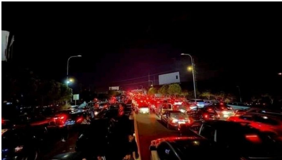
Další záběry z evakuace v Libanonu

Izraelské hrozby nebyly vnímány jako plané, ale bylo jasné, že pozemní operace v Libanonu by byla velmi nákladná ve všech ohledech (lidských, reputačních i finančních), a proto se Izrael chce o své břemeno podělit s USA. Sionistické jařmo je lepkavé, má snahu se přilepit na něco nebo někoho, kdo řádění, zločiny a terorismus sionistického Izraele zaplatí za něj. A dosud tuto roli měly vždy USA. Jenže, to by musel Hizballáh a Irán útočit na izraelská města (nikoli na vojenské cíle) nebo by musel Hizballáh provést pozemní útok na Izrael z libanonského území, aby Amerika přímo zasáhla do konfliktu.