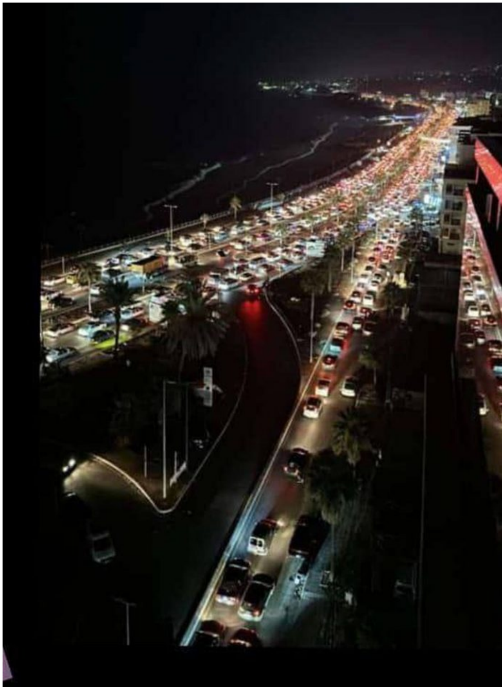
Evakuace na magistrále na výpadovce z Bejrútu směrem na sever

Proto vidí jediné východisko v pokračování války v naději, že USA v určitém okamžiku přijdou svému “51. státu” na pomoc. A v tom okamžiku nejen veškeré náklady, ale především veškeré zločiny IDF budou promlčeny, protože po vstupu americké armády do konfliktu si nikdo nedovolí Američany a jejich sionistického spojence z něčeho obvinit.