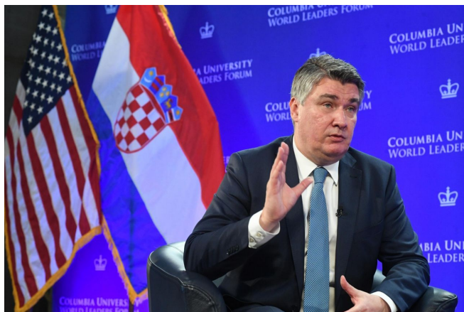
Zoran Milanović, chorvatský prezident

Aby se zabránilo ještě většímu skandálu, požádal premiér Andrej Plenković velení NATO o odtajnění dokumentu zpětně, ale skandál už je prostě na světě. Ministr obrany totiž tvrdil, že mise chorvatské armády na Ukrajině, o které má hlasovat parlament a prezident tuto misi hodlá vetovat, se má týkat jen údajné komunikace mezi NATO a Kyjevem, tedy zajištění jakési pošty mezi Bruslem a Zelenského vládou.