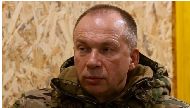
Náčelník genštabu AFU gen. Alexander Syrský