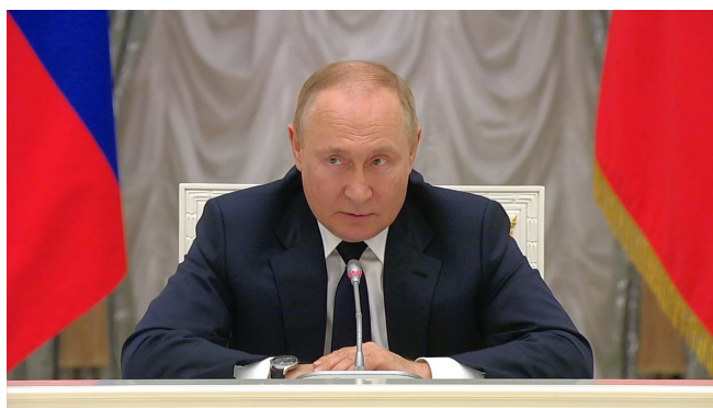
Vladimir Putin, ruský prezident

Dalo se čekat, že Vladimir Putin má něco přichystáno v rukávu před americkými volbami, a opravdu je to tady. Ruský prezident před několika hodinami vedl do pohotovosti ruské strategické síly a nařídil [1] zahájení jaderného cvičení tzv. ruské jaderné triády, tedy pozemních vojsk, námořnictva a letectva. Dojde k otestování odpalů strategických nosičů jaderných hlavic, stejně tak k odpalu taktických nosičů a raket s plochou dráhou letu. Cvičení jaderné triády pouhých 7 dní před americkými volbami v USA je tak trochu návratem do minulosti, když podobná cvičení před volbami v USA prováděl Sovětský svaz. Může se ale jednat i o reakci na poslední uniklé informace z Pentagonu.