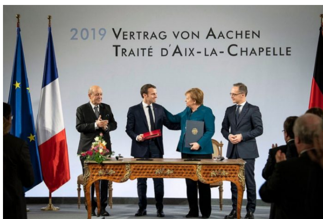
Podpis Aachenské smlouvy mezi Emanuelem Macronem a Angelou Merkel

Celá Evropa se postupně fašizuje v souvislosti s podpisem Aachenské smlouvy mezi Německem a Francií z roku 1919. Tato smlouva, o které se v mainstreamových médiích mlčí, zcela redefinuje poválečné uspořádání v Evropě a stanovuje cíle reformátu Evropy jako takové, nejen Evropské unie. Podle této smlouvy by se úředními jazyky v Evropě měla stát němčina a francouzština, namísto angličtiny. Veškeré procesy spojené s anti-rusismem v Evropě, vychází z cílů této smlouvy, tedy obnovení moci Německa v Evropě po II. sv. válce, přičemž toho nelze dosáhnout bez obnovení pozice němčiny v Evropě.