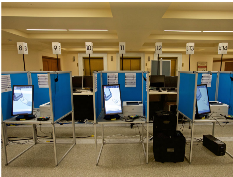
Americké "loterijní" terminály pro hlasování

Ta snadnost falšování spočívá v tom, že když státní orgán nebo tzv. režim chce zfalšovat volby ve svůj prospěch, např. ve prospěch Deep State , ve prospěch Pětimotolice , či ve prospěch jiných "sviní", tak se to udělá tak, že režim prostě zevnitř do systému nasype korespondenční hlasy a započítá je do okrsku v zahraničí. V případě občanů ČR jde podle odhadů o 500 až 750 000 občanů ČR zdržujících se v zahraničí, a to je tak obrovská armáda voličů, která může obracet v ČR volby pomocí korespondenčních hlasů. Tedy, abychom byli přesnější, ne přímo oni, ale aktéři režimu jejich jménem. Ministerstvo zahraničních věcí ČR totiž odhaduje, že v současné době dlouhodobě v zahraničí žije asi 600 tisíc Čechů.