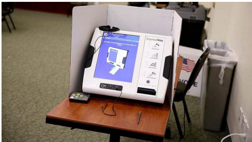
Každý americký stát používá jiné hlasovací mašiny

Do obálky pak vloží zvlášť identifikační lístek a obálku s hlasovacím lístkem uvnitř. To celé pak odešle na zastupitelský úřad v daném cizím státě. Pokud bude chtít někdo z českého Deep State zfalšovat volby, prostě vyplní 150 000 korespondenčních hlasů rozprostřených mezi třeba 10 států v zahraničí a jednotlivé ambasády prostě pošlou do Prahy výsledky voleb, tedy počty hlasů pro jednotlivé strany.