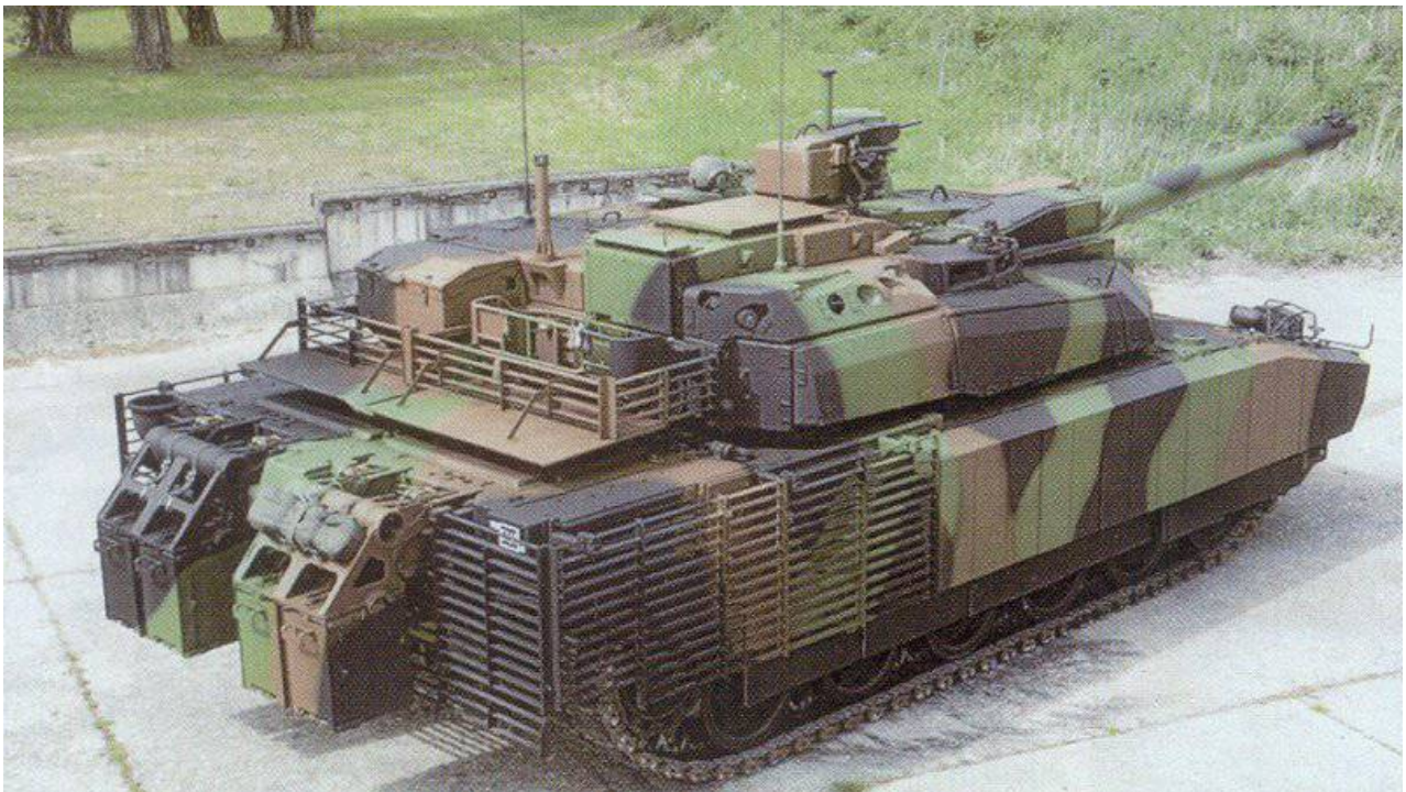
Tank "Leclerc" se sadou pro městský boj AZUR

Ale obecně to není ani ve standardní verzi zdaleka špatná volba, vzhledem k opravdu dobré pohyblivosti tanku, který se stále může osvědčit v ukrajinském černozemním korytě, rychlým spěchům zaujmout výhodné pozice a vrátit se zpět, pokud tyto pozice nemohl být držen.