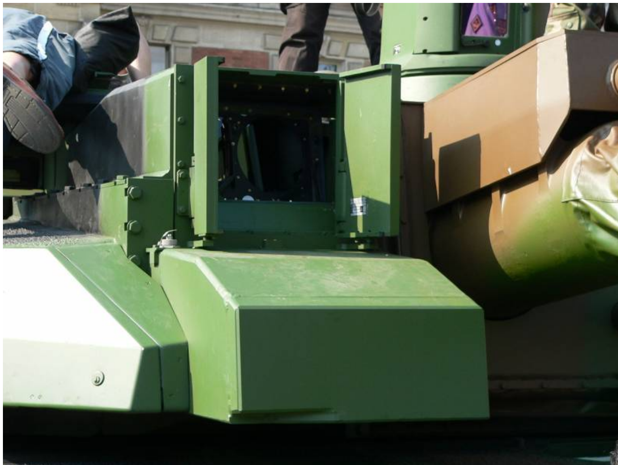
Pohled střelce tanku

podle standardu: panoramatický zaměřovač a sledovací zařízení, které má podobné vlastnosti jako zaměřovač střelce - také denní kanál, termokameru a dálkoměr.