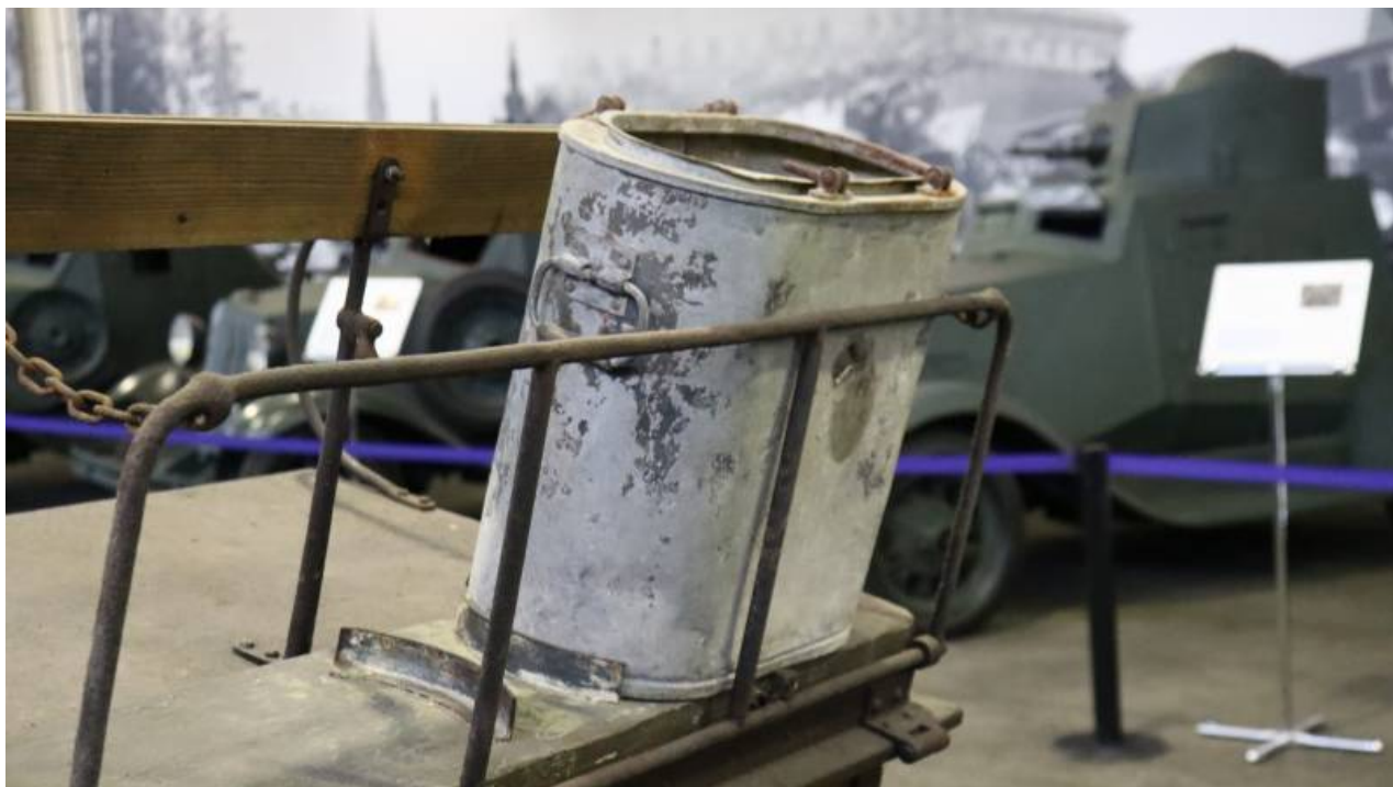
Polní kuchyně Kleine Feldkuche.

Jedním z nejzajímavějších exponátů Engines of War je samozřejmě protiletadlový přívěs Infanteriefahrzeug 5 MG Wagen 36 tažený koňmi. Obvykle byly takové vozíky připojeny k pěchotním praporům, aby bojovaly s nepřátelskými letadly.