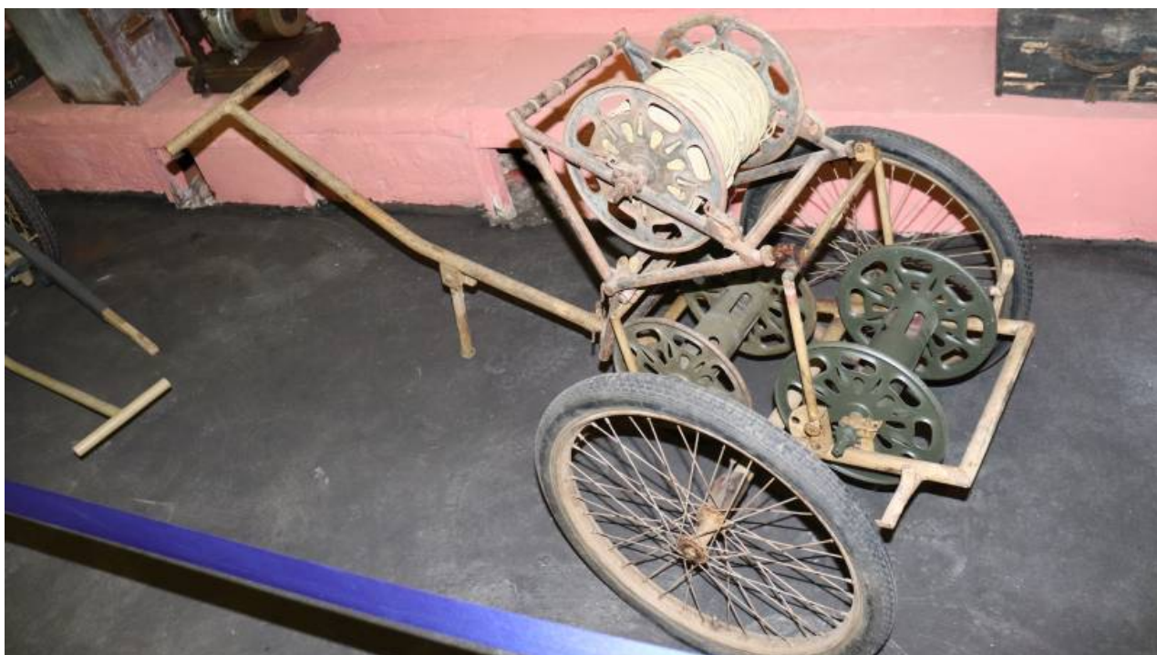
Ruční vozík signalisté model 1942.