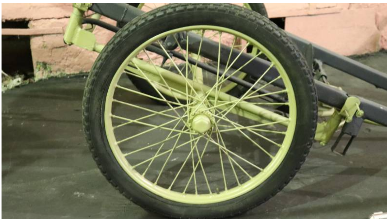
Ruční sanitní vozík Wehrmachtu.

Jedna lidská síla byla také zapotřebí k přesunu Handkarren für Sanitatgerät modelu roku 1942 - vozíku pro evakuaci raněných z bojiště. Vůz mohl být vybaven bednou na léky a celková nosnost dosahovala 150 kg. V současné době se nedochovalo mnoho fotografií této vzácnosti, o skutečných exemplářích nemluvě. Vystavený vozík pochází z roku 1944.