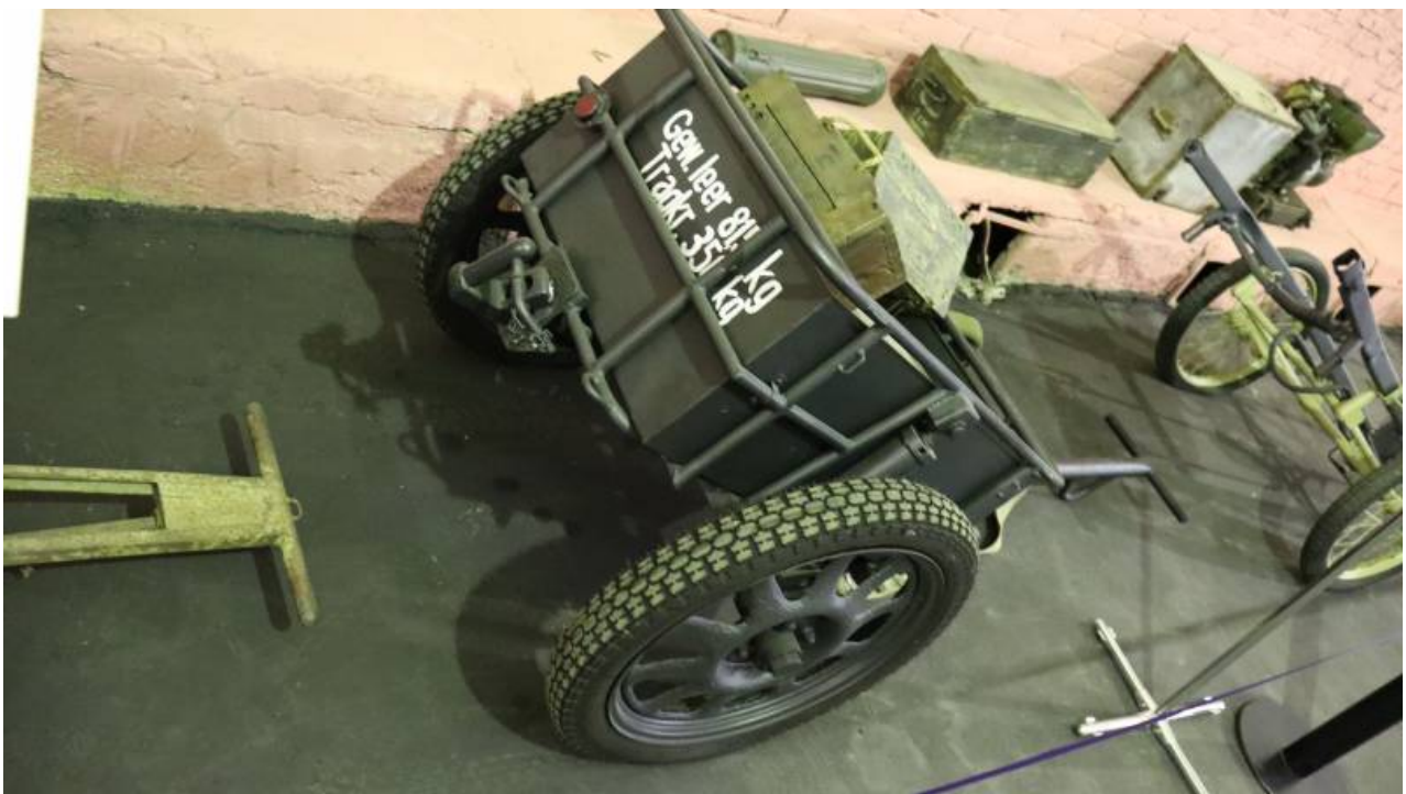
Univerzální Infanteriekarren lf. 8.