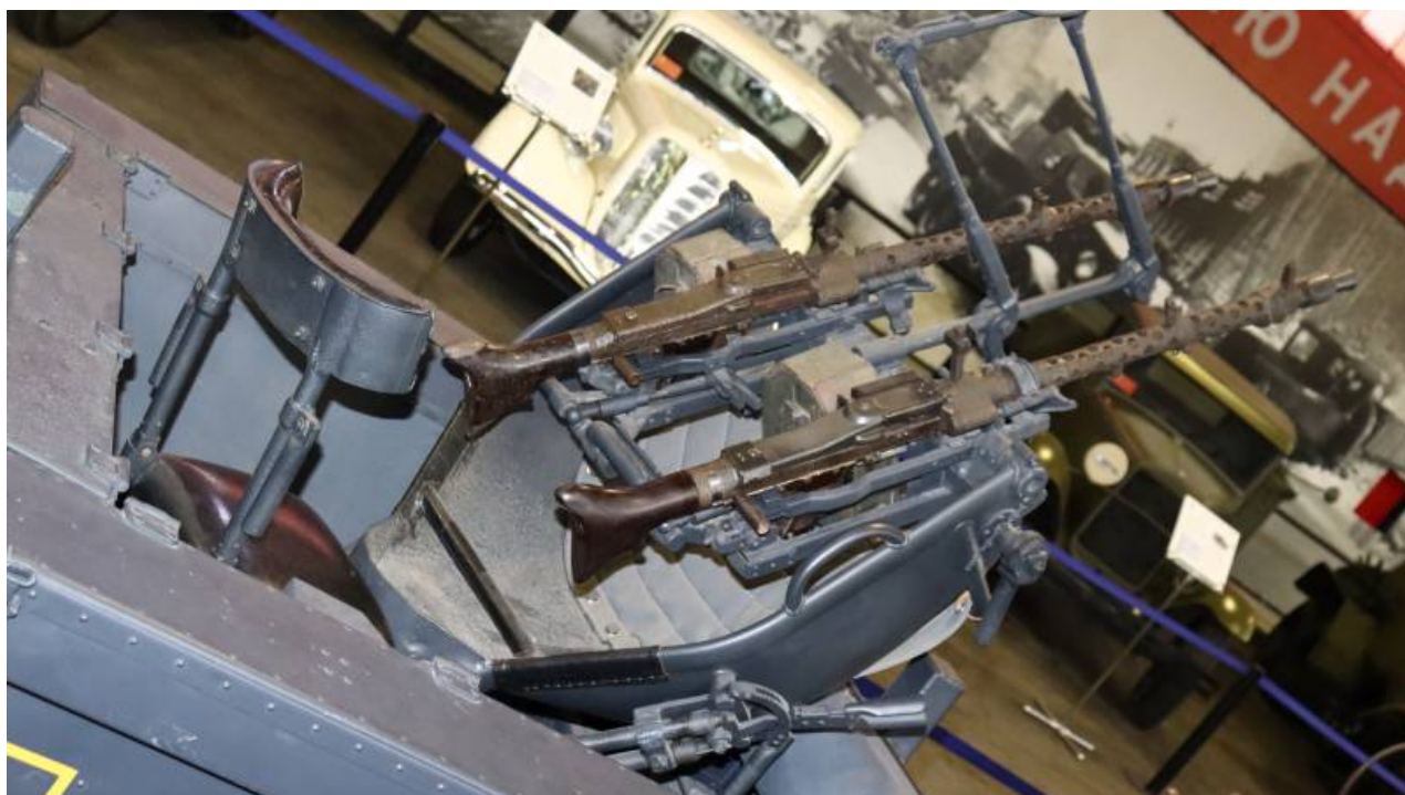
Protiletadlový přívěs nacistů v muzeu "Motors of War".