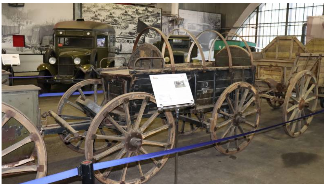
Lehký vůz Kleine Heeresfahrzeug 3 (Hf. 3).