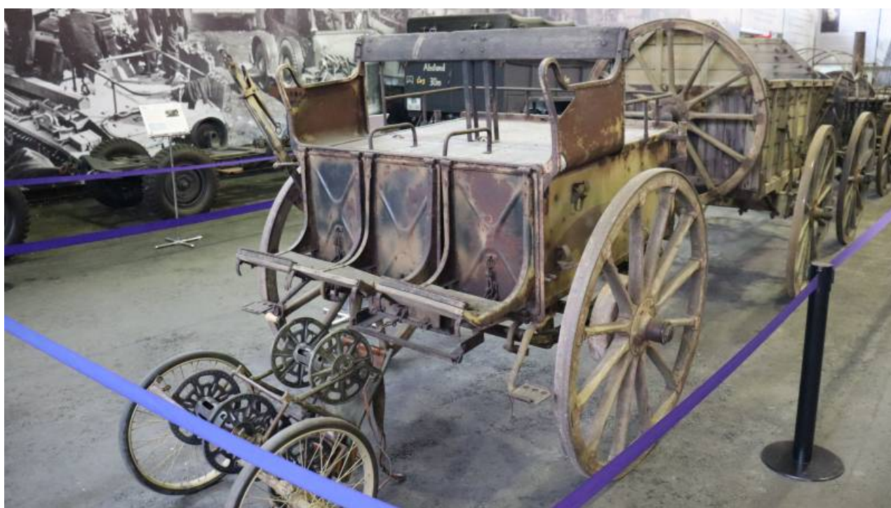
Leichter Fernsprechwagen (lehký telefonní vůz) model 1929. Lehký vůz Kleine Heeresfahrzeug 3 (Hf. 3).

Vyplatí se začít u signalizačního vozu s tradičně dlouhým německým názvem Leichter Fernsprechwagen (lehký telefonní vůz) z roku