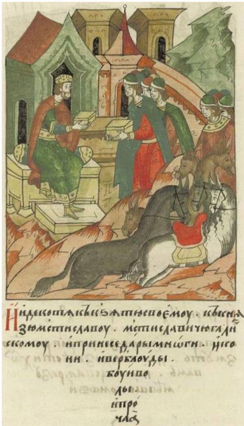
Chán Kotyan dává dárky Mstislavu Udatnému. obličejová klenba

Polovecké ženy v oděvu a špercích se téměř nelišily od kyjevských žen nebo Pskovitů. Jejich oblečení bylo jen praktičtější pro život ve stepních osadách. Polovecké ženy nosily dočasné prsteny - tradice ruského superetna. Na hrudi a pásech mnoha byly vícepraprskové hvězdy a kříže v kruhu - amulety. To je také tradice Rusů.