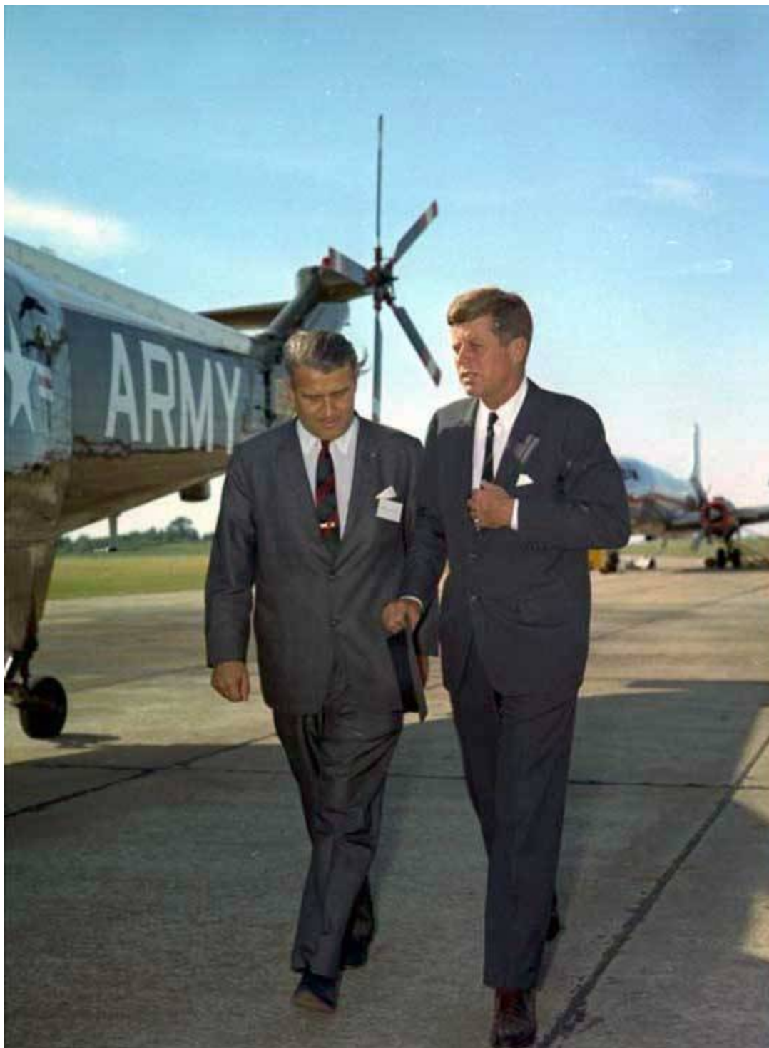
von Braun a prezident John F. Kennedy. 19. května 1963