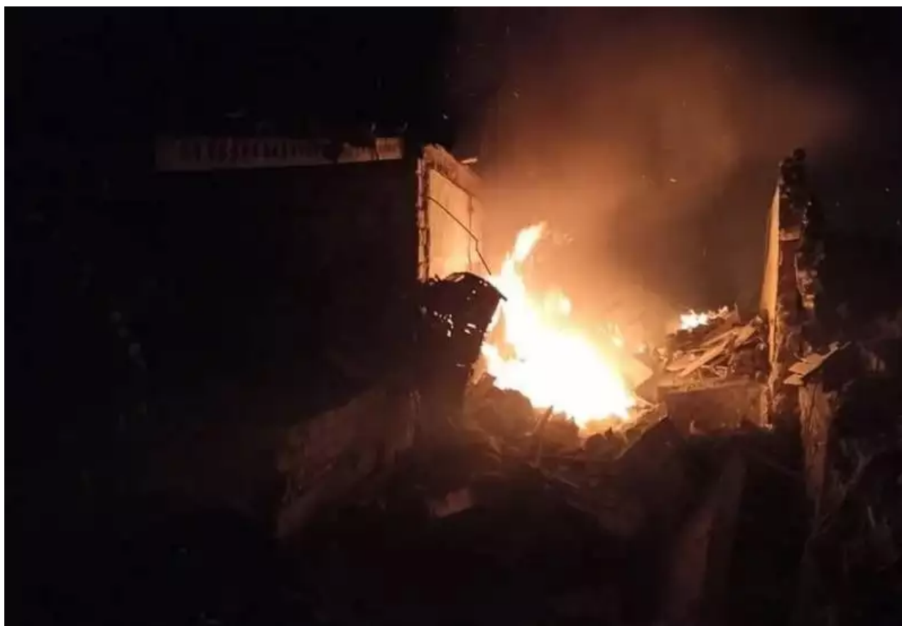
Výcvikové středisko Ozbroyených sil Ukrajiny po útoku

zprávě ministerstva. Uvádí se, že námořní drony byly vypuštěny z pobřeží města Oděsa. Následně směřovali podél bezpečnostní zóny „obilního koridoru“ a poté změnili trasu směrem k ruské lodní základně v Sevastopolu. Ministerstvo obrany s odvoláním na stanovisko expertů naznačuje, že zařízení mohla být vypuštěna z jedné z jejich civilních lodí, „pronajatých Kyjevem nebo jeho západními patrony pro vývoz zemědělských produktů“.