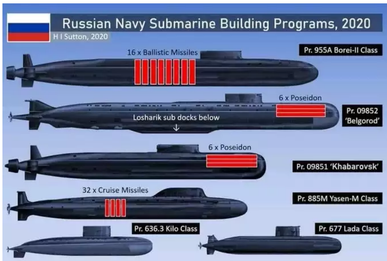
Porovnání velikostí ruských ponorek

dně do 10 měsíců, její torpéda dokáží proplout zadanou trasu a dorazit se do jakéhokoli bodu na zeměkouli. Poseidon je v podstatě autonomní neobydlený ponorkový aparát, který se umí pod vodou pohybovat rychlostí 200 km/hod.“