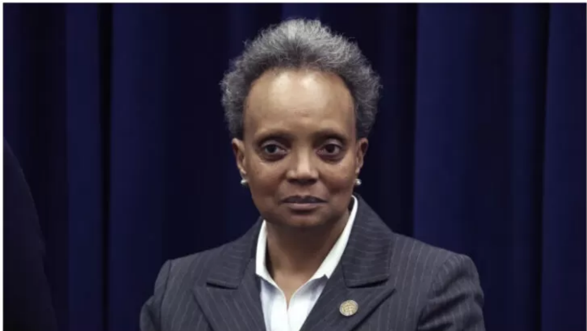
Chicago Mayor Lori Lightfoot becomes only the second one-term Chicago mayor in 40 years.

Proces odstraňování ChM je v USA již v plném proudu. Naposledy byla ve volbách starosty Chicaga sesazena starostka Lori Lightfootová. Byla první černošskou starostkou Chicaga a první otevřeně homosexuální starostkou a také první úřadující starostkou Chicaga, která prohrála za posledních čtyřicet let.