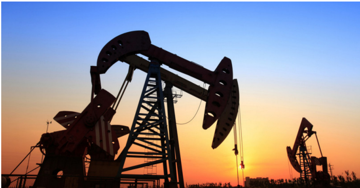
Těžařské zařízení