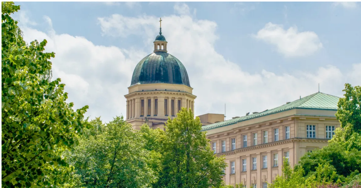
Budova KTF.