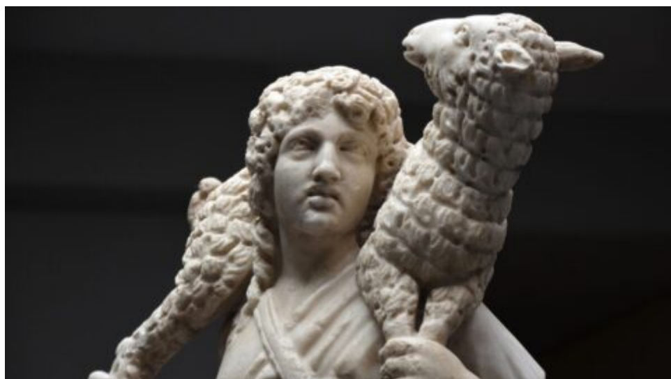
Obrazy naděje: Dobrý pastýř