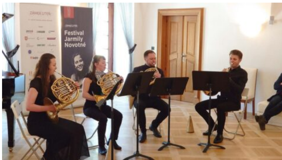
Zámek Liteň přichystal hornový koncert do adventního času