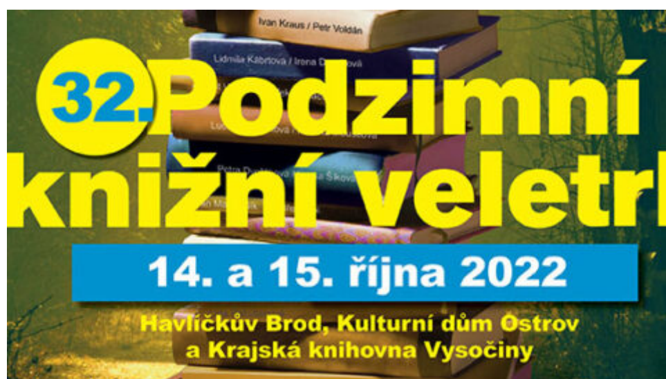
Hledání normálního světa – Podzimní knižní veletrh zve návštěvníky na 14.–15. října do Havlíčkova Brodu