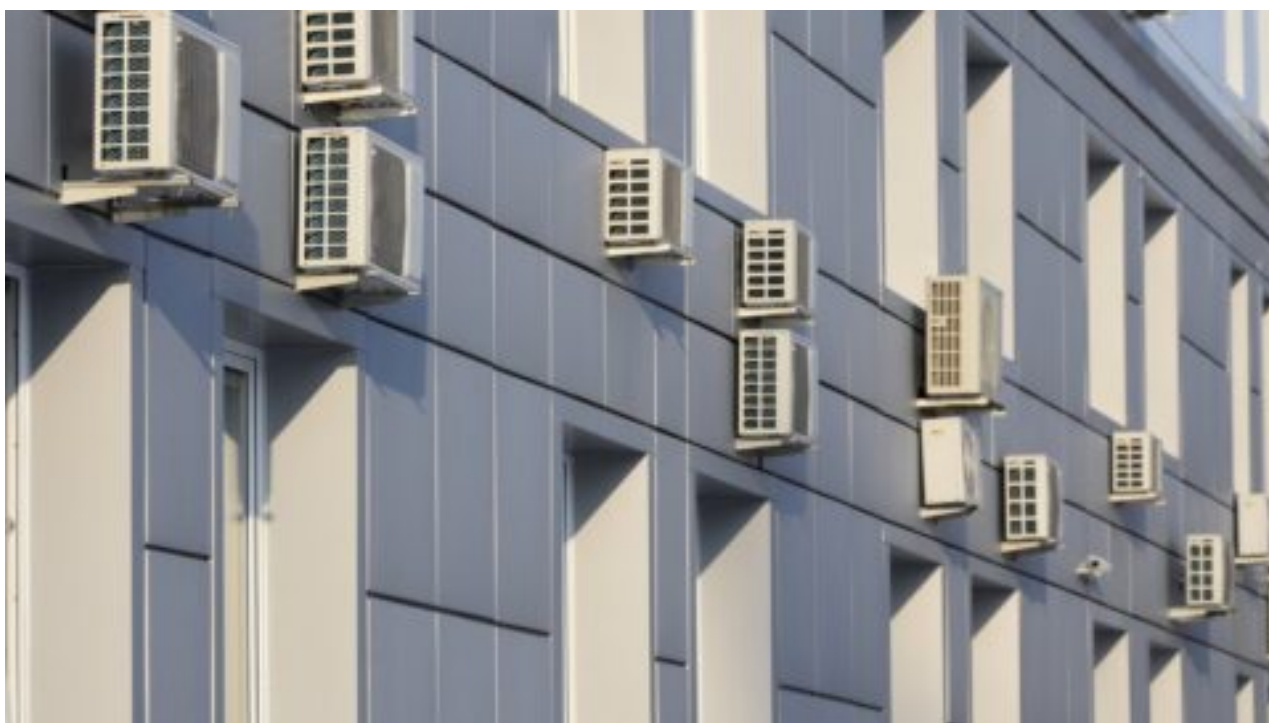
Do Evropy se ve velkém pašují problematické chladící plyny z Číny, tvrdí organizace EIA