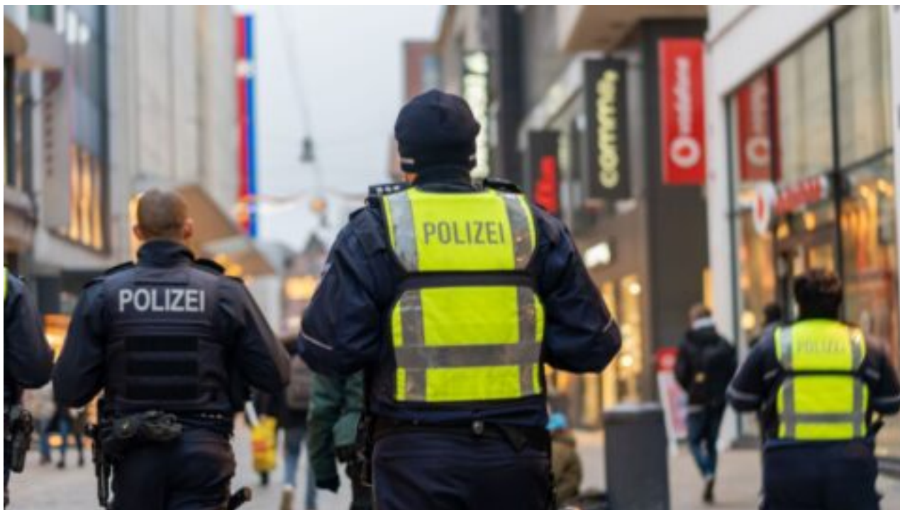
Německo se potýká s nárůstem kriminality, problémem jsou mladí cizinci