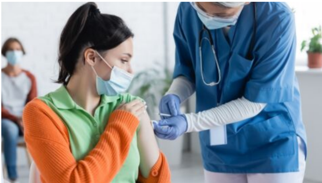
Vrchní státní zastupitelství obdrželo trestní oznámení k očkování proti covidu-19