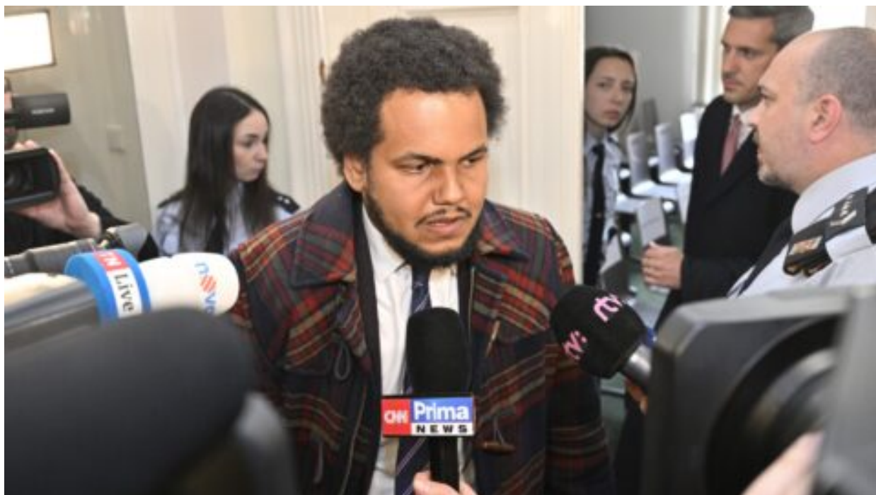
Feri půjde za znásilnění dívek na tři roky do vězení, potvrdil odvolací soud