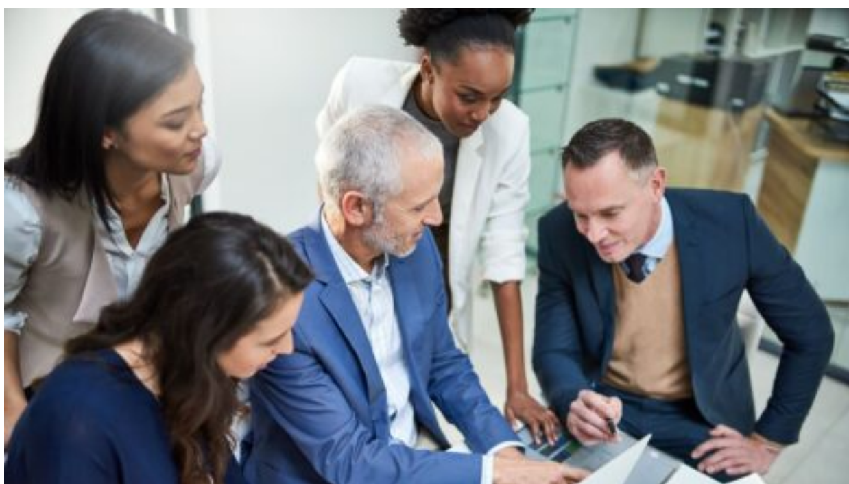
Cizinci ze sedmi zemí nebudou v ČR potřebovat povolení k práci dle nového návrhu vládního nařízení