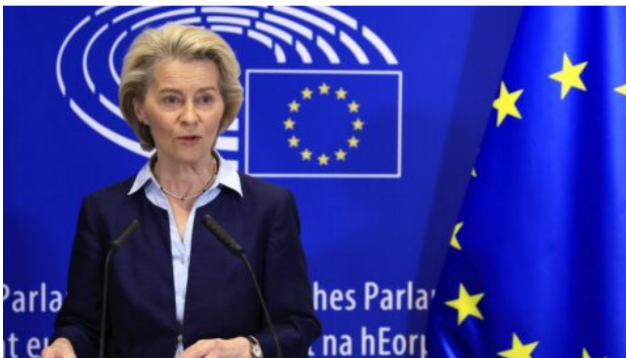
Vlna žalob na předsedkyni Evropské komise von der Leyenovou