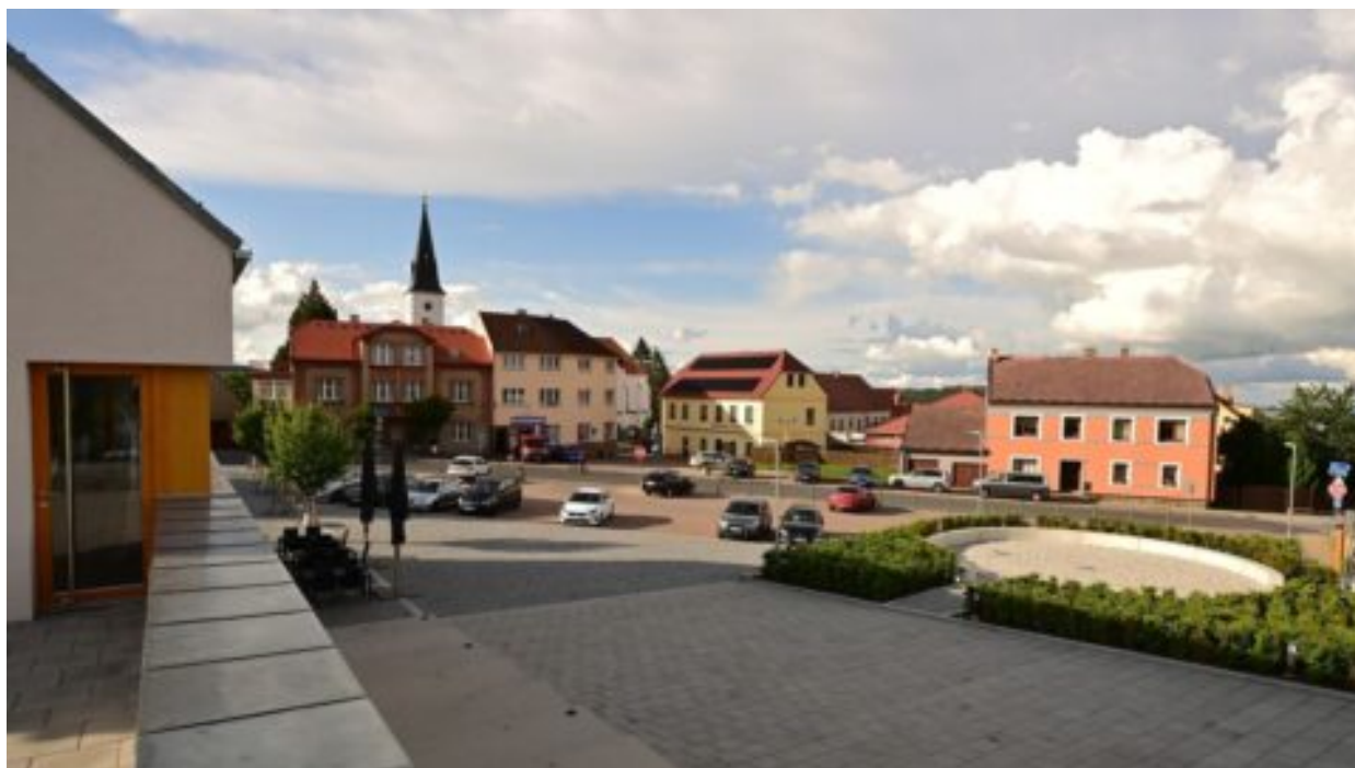
Titul Vesnice roku 2024 dnes získala obec Vacov z Jihočeského kraje