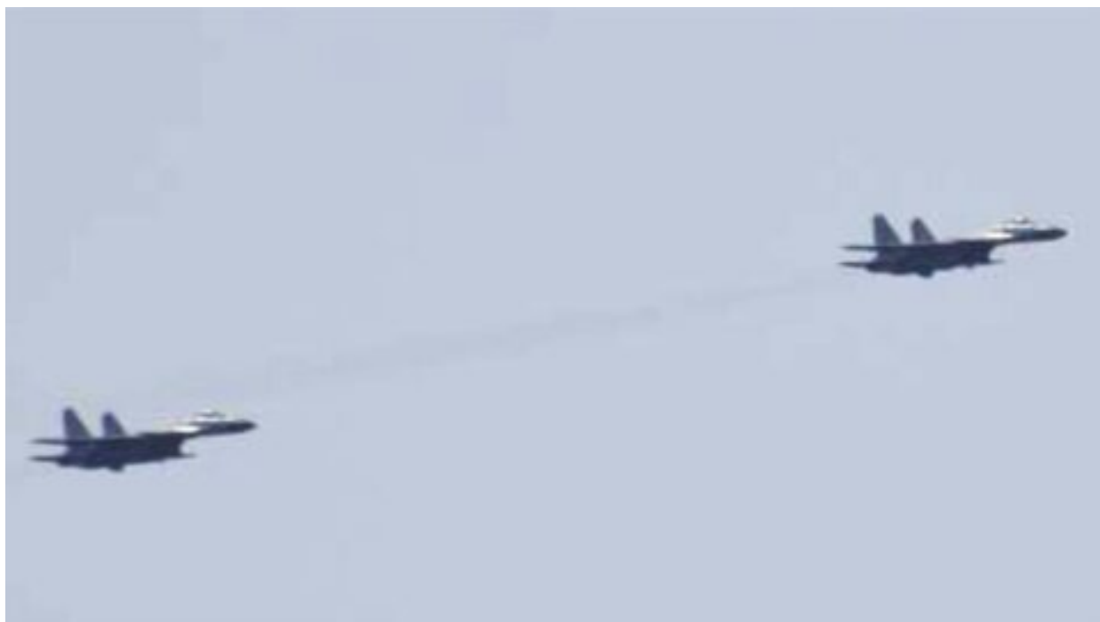
Čínský vpád do Japonska