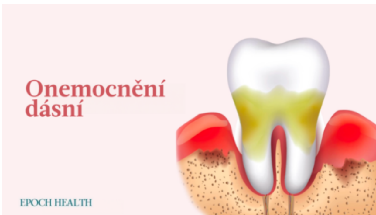
Onemocnění dásní: Příznaky, příčiny, léčba a přírodní postupy.