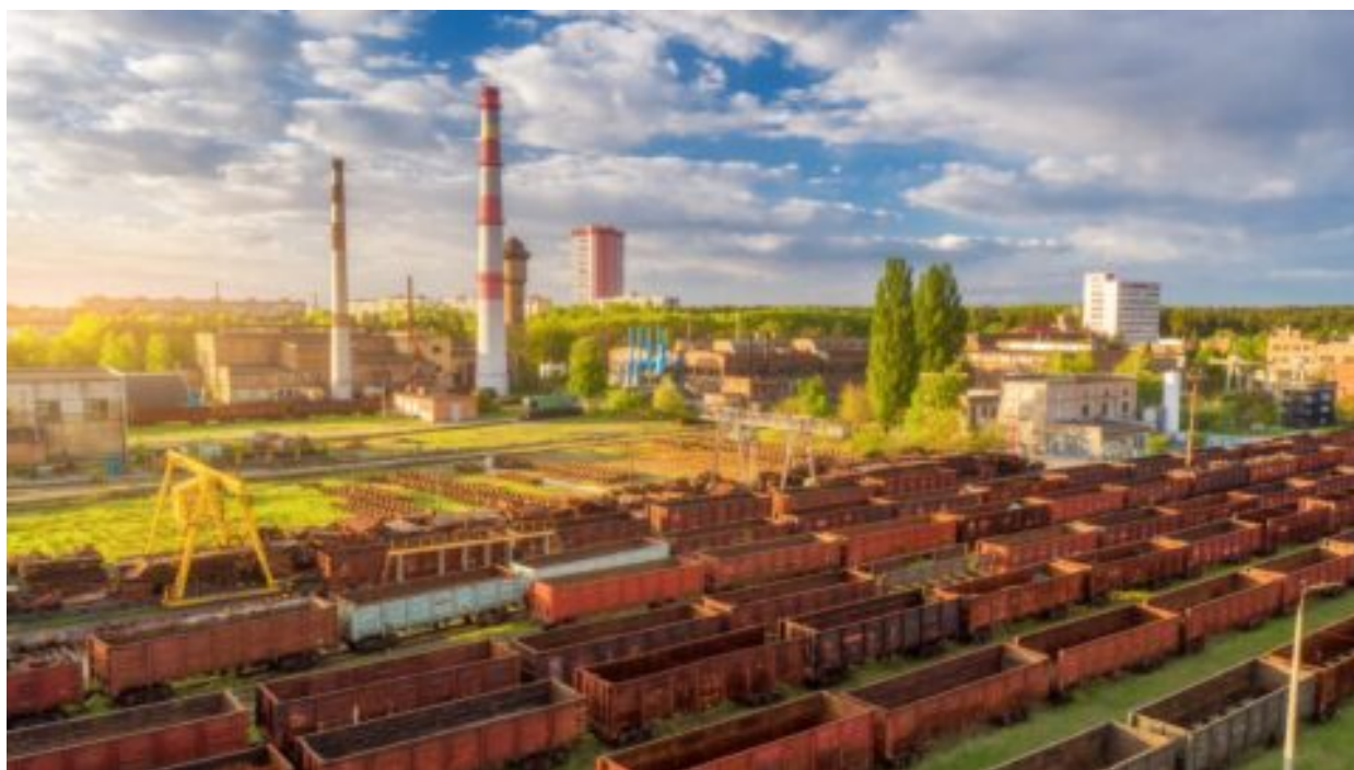
Kvůli naivitě se z Evropy může stát kontinent bez výrobců, varuje předsedkyně hospodářského výboru EP