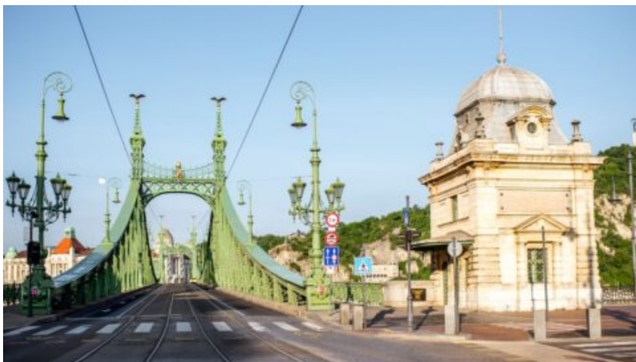
EU bojkotuje Maďarsko – a brání tak vlastnímu rozhodnutí o dluhu a Draghiho plánu