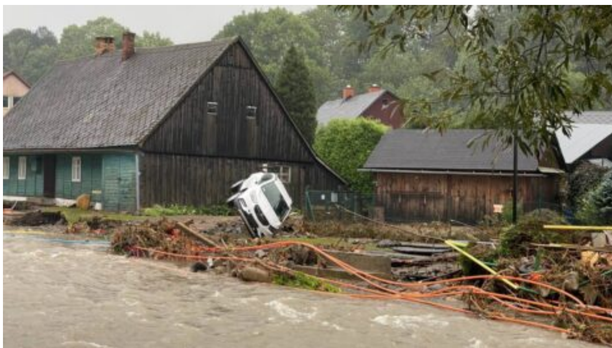
Při povodních zachránili hasiči a policisté již stovky lidských životů. „Na oplátku chceme jen jednu jedinou věc,“ apelují