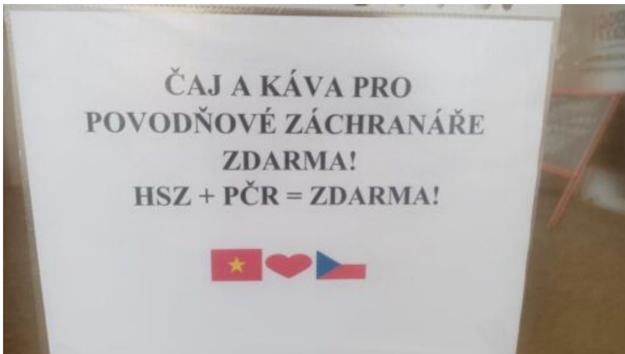
Vietnamské krámky nabízejí záchranářům teplé nápoje zdarma