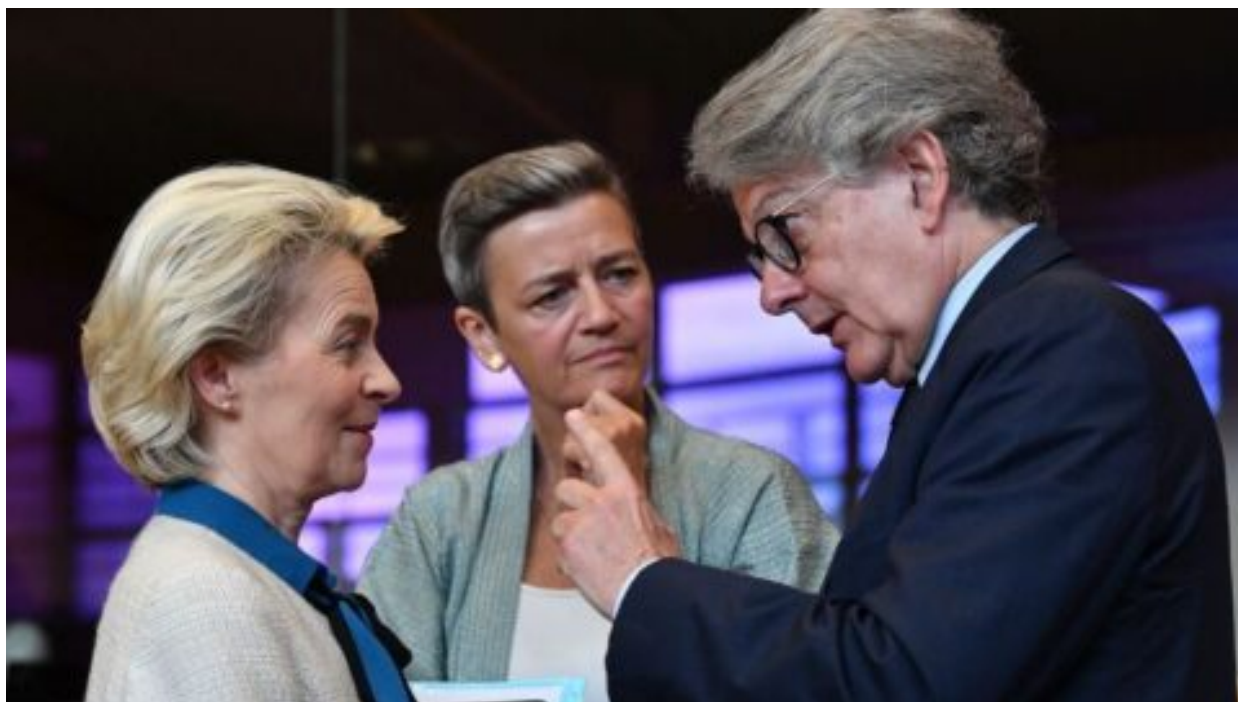
Francouzský eurokomisař Breton rezignoval v reakci na krok Leyenové