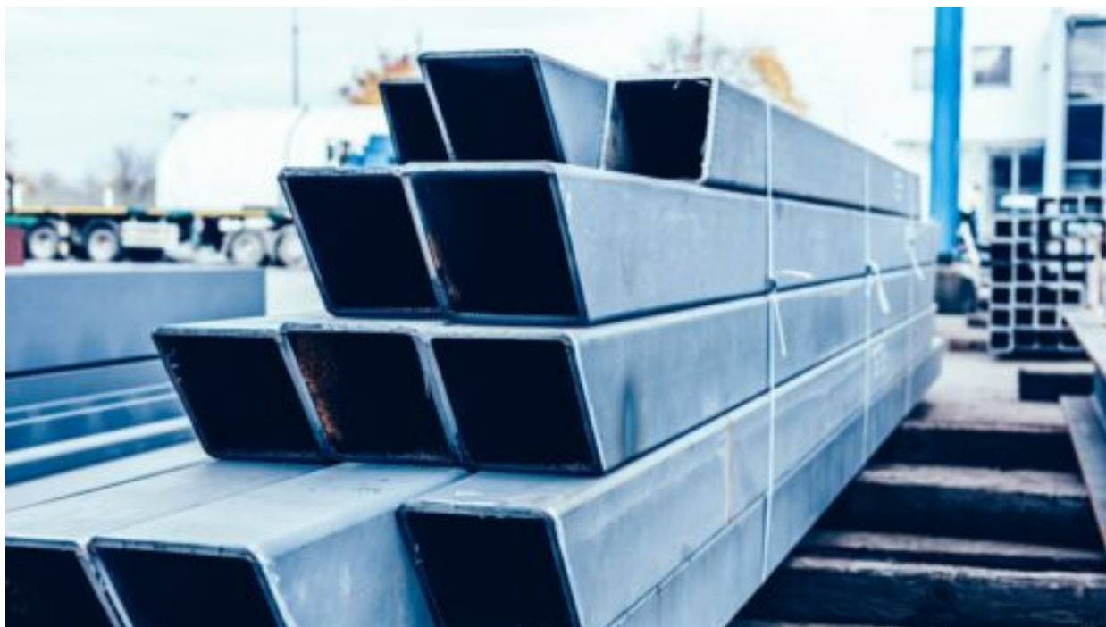
Výroba oceli v ČR na historickém minimu, předpovědi nejsou příznivé