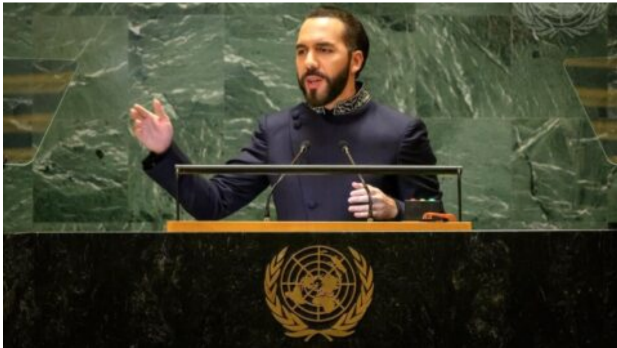
Prezident Bukele vzkázal mezinárodnímu společenství, že „ještě není pozdě postavit most a uniknout bouři“