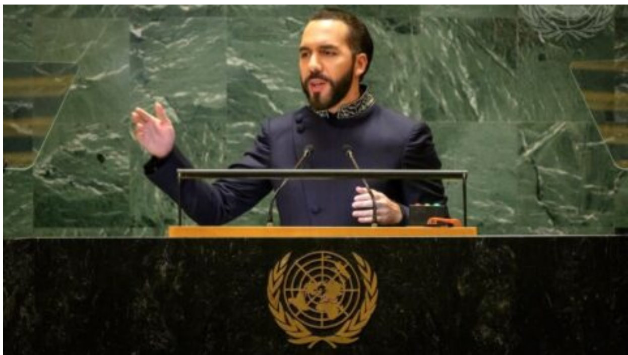
Prezident Milei vzkázal mezinárodnímu společenství, že „ještě není pozdě postavit most a uniknout bouři“