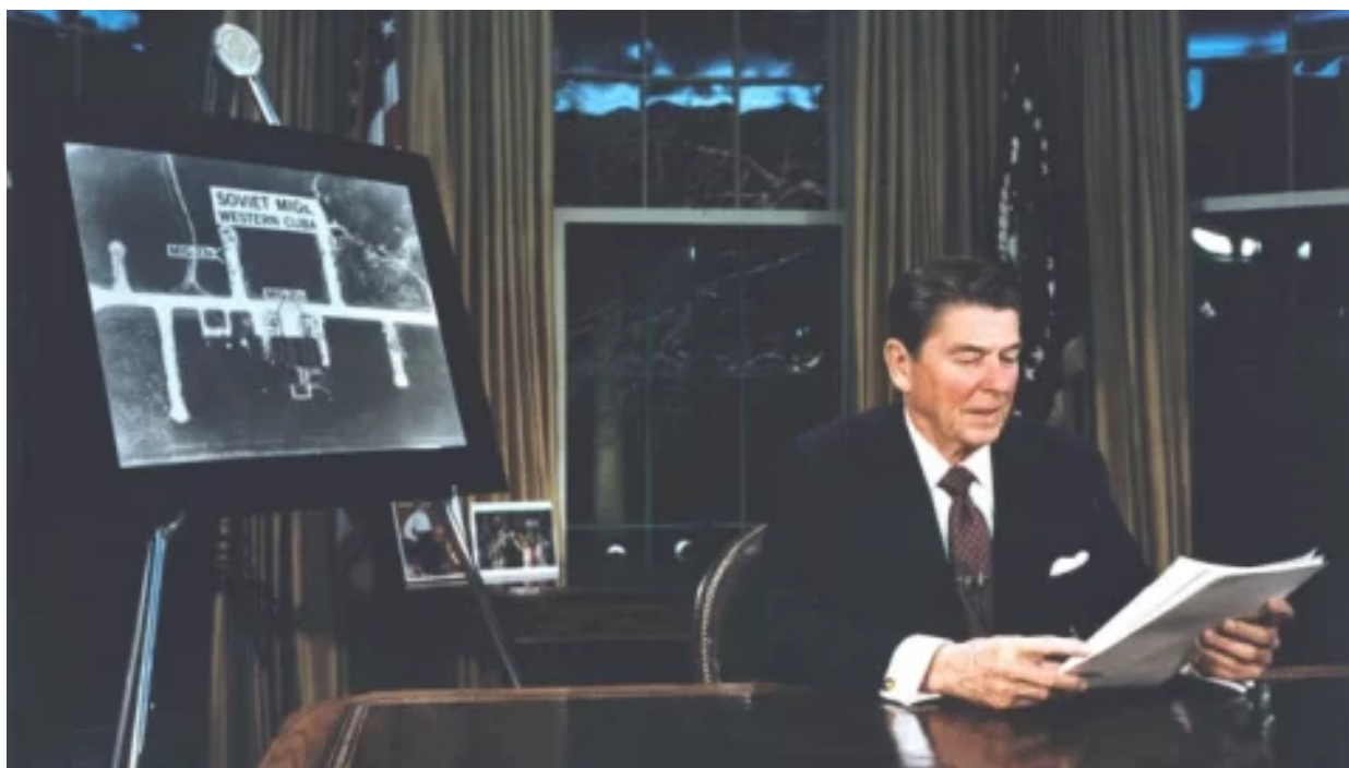
Muž, který zachránil svět před třetí světovou válkou