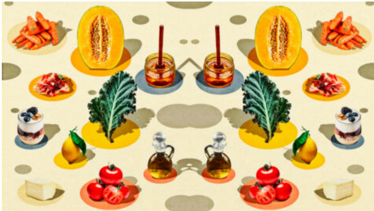
5 potravinových párů, které byste podle vědců měli jíst společně