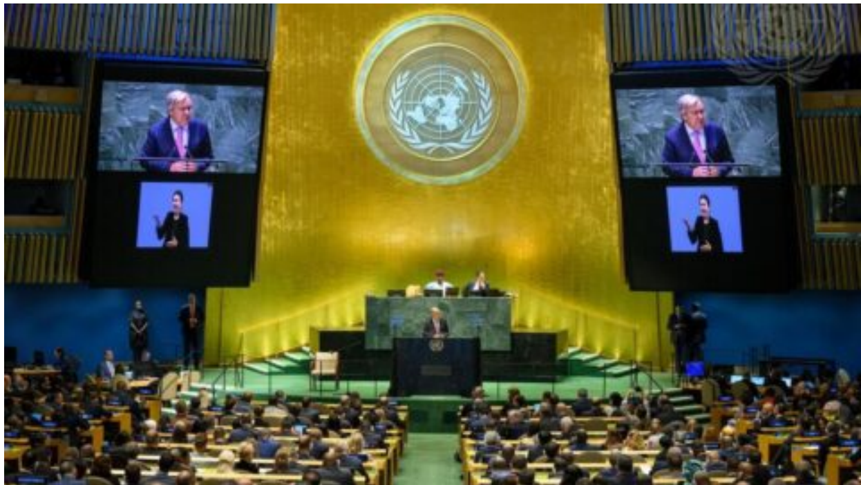
OSN přijala Pakt pro budoucnost. Argentinský tajemník jej nazval „totalitní mezinárodní agendou“