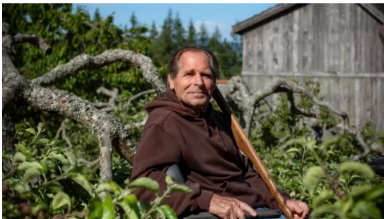
Zahrada, jak ji příroda zamýšlela: Sad vzkvétá, přestože se nezalévá ani neobdělává