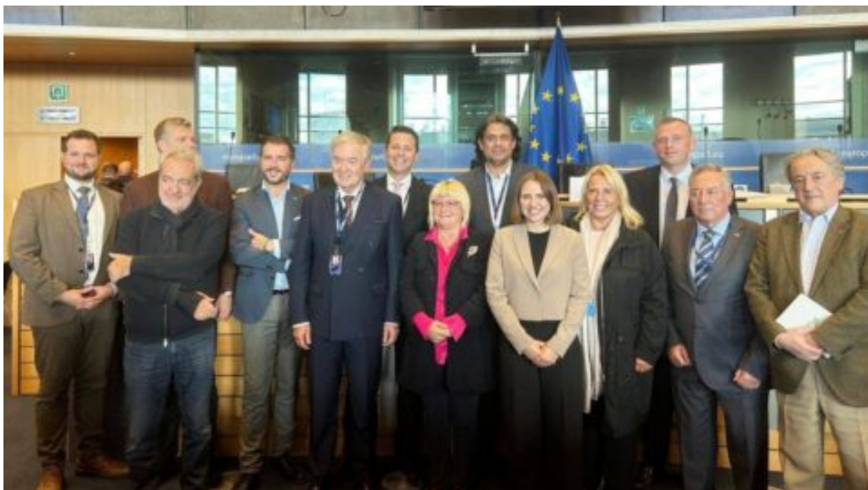
Hnutí Patrioti pro Evropu posílilo o dva europoslance