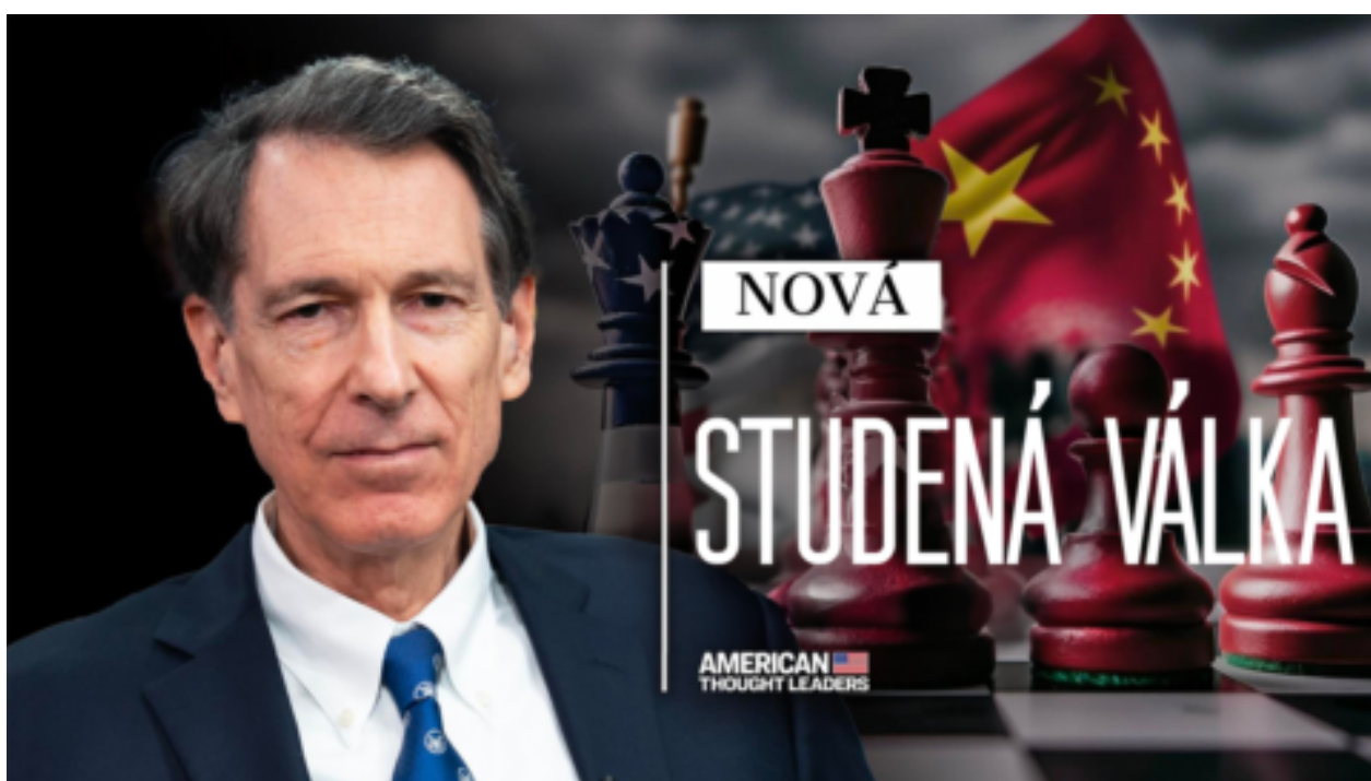
Jak by se měly USA a západní země bránit hybridní válce s Čínou?

Průzkumníci oceánů objevili tisíce metrů pod hladinou podmořskou horu, kterou obývá vzácná chobotnice Casper