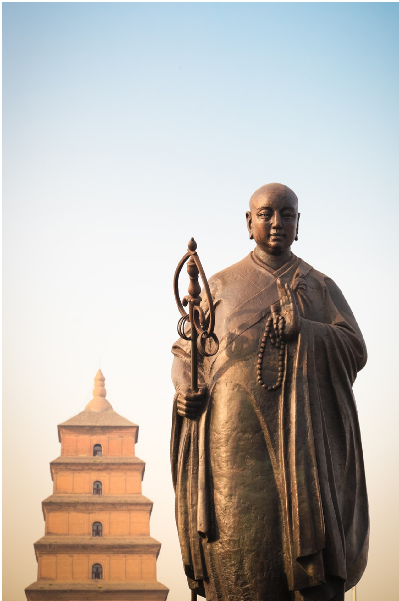
Socha mnicha dynastie Tang Xuanzang v Xi'anu.