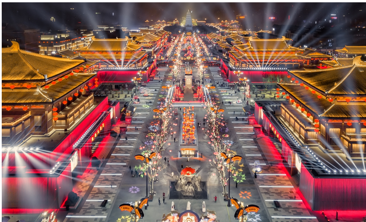
Scéna v Datang Everbright City v Xi'anu

Autor: Lou Kang Zveřejněno: 18. května 2023 00:41