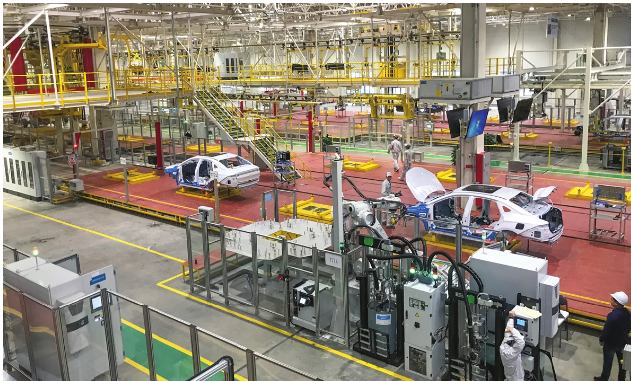
Továrna na nová energetická vozidla v jihočínské provincii Guangdong

Čína uspořádá v Pekingu od 28. listopadu do 2. prosince první China International Supply Chain Expo, první celosvětovou národní výstavu na téma dodavatelského řetězce, s cílem poskytnout mezinárodní platformu pro prosazování řádné a efektivní průmyslové synergie napříč zeměmi. K dnešnímu dni se na akci přihlásilo asi 100 podniků, přičemž potvrzené americké společnosti tvoří největší skupinu mezi zahraničními nadnárodními společnostmi, uvedli v pátek čínští představitelé.