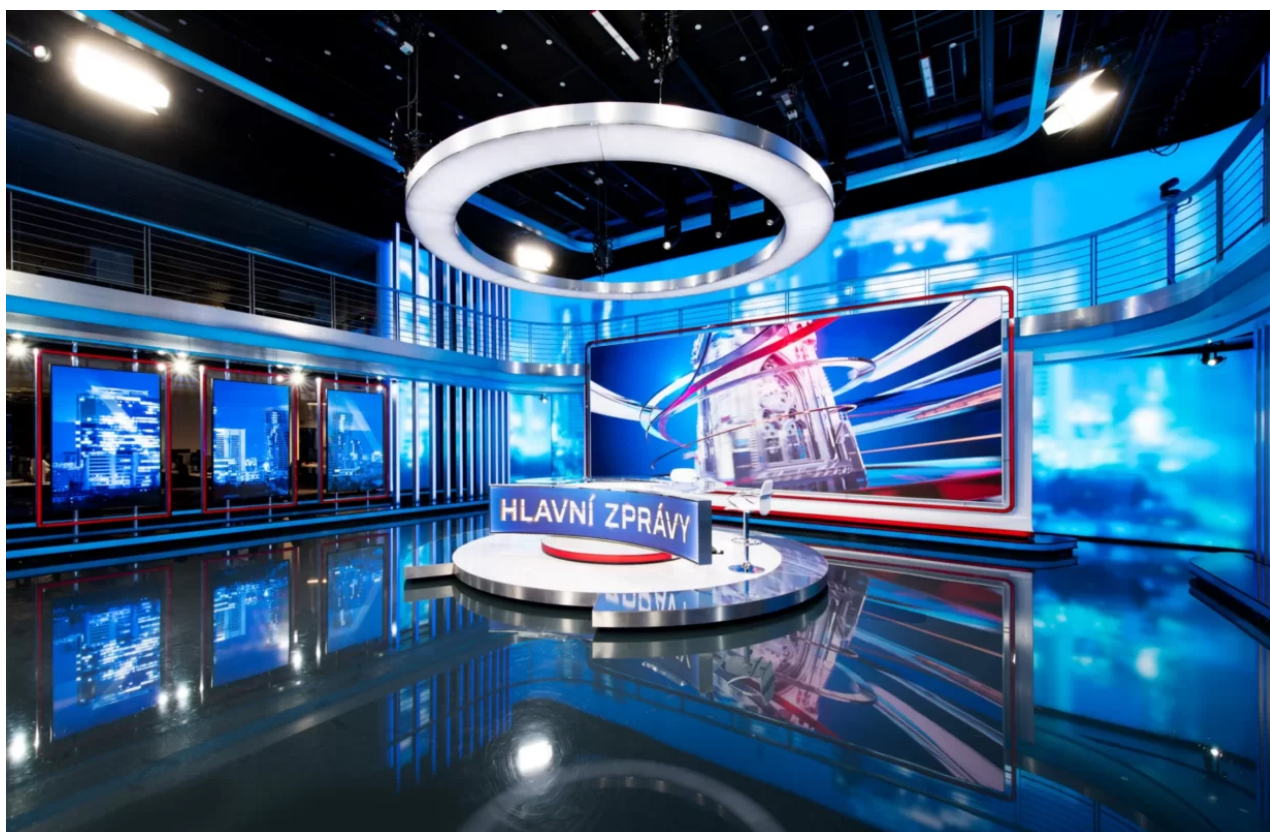
Studio Prima CNN News