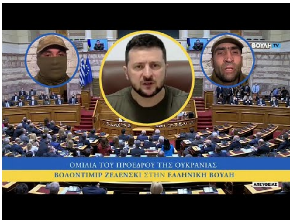
Zelenskij s poslancem Azov (vpravo) během projevu v řeckém parlamentu v dubnu.

Jeden z nejmocnějších ukrajinských oligarchů z počátku 90. let Ihor Kolomojskij byl raným finančníkem neonacistického praporu Azov. Podle zprávy agentury Reuters z roku 2015 (zeleně označeno):