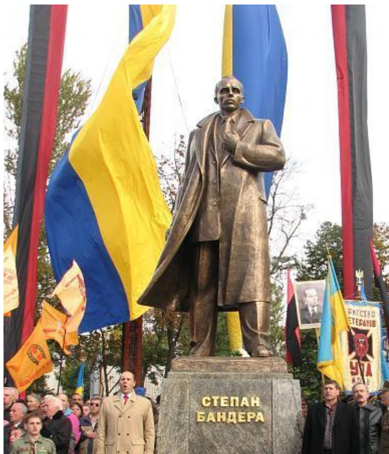
Banderův pomník ve Lvově.

Takže USA tajně udržovaly ukrajinské fašistické myšlenky na Ukrajině při životě, dokud nebylo dosaženo alespoň ukrajinské nezávislosti. “Mykola Lebed, válečný náčelník Bandery na Ukrajině, zemřel v roce 1998. Je pohřben v New Jersey a jeho záznamy jsou v Ukrajinském výzkumném institutu na Harvardské univerzitě,” uvedla studie amerického Národního archivu.