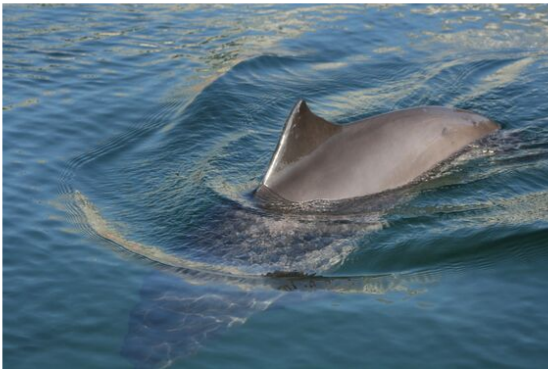
Sviňucha obecná v Baltském moři