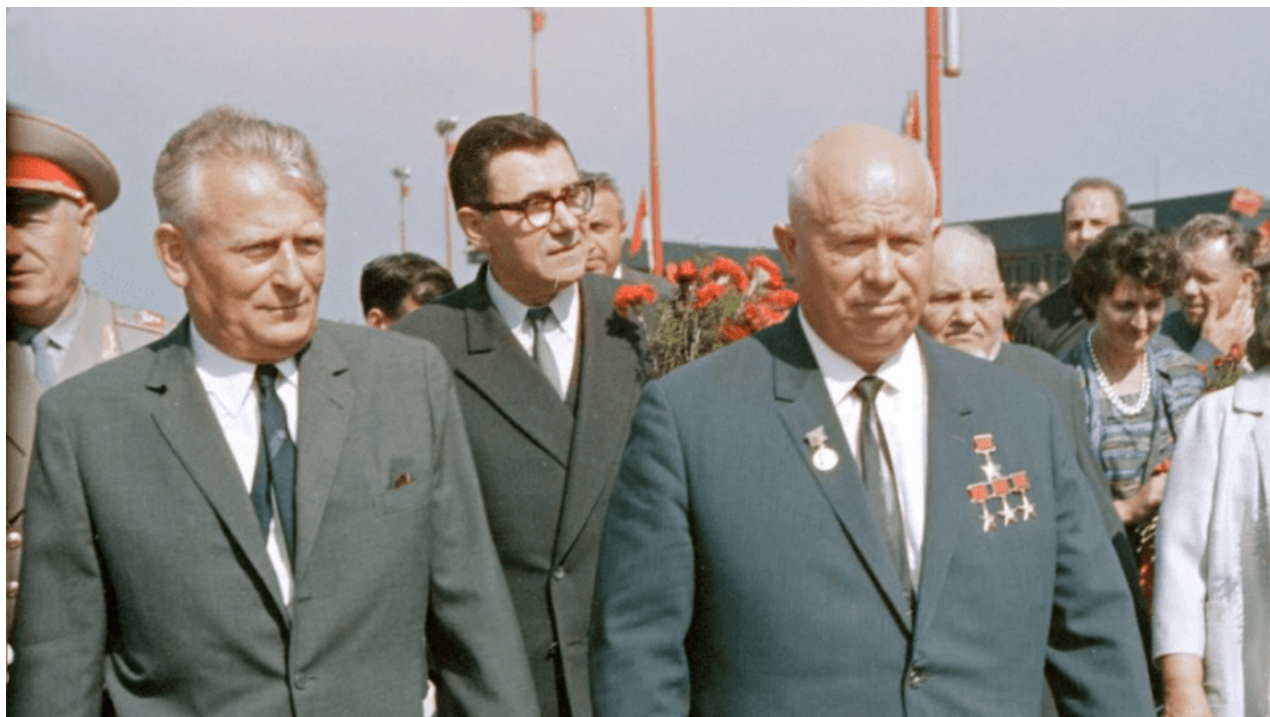
A . Novoty a N.S. Chruščov v Praze při návštěvě v roce 1962, to brýlaté za nimi je ministr zahraničí SSSR Andrej Gromyko a ta ruka v bílém patří Boženě Novotné vedle které šla ještě Nina Chruščovová.